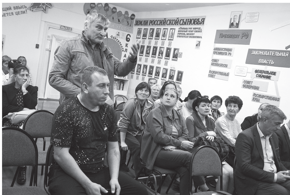
Хочу задать вопрос.

Информационная встреча главы района состоялась на минувшей неделе с жителями Сидиминского поселения.