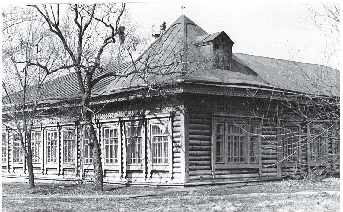
С этой школы зарождалась система образования в районе.

После Гражданской войны, когда страна стала решать мирные экономические и социальные задачи, со всей остротой встал вопрос о ликвидации неграмотности населения, тогда же и было введено всеобщее четырехклассное образование. В 1935 году в районе насчитывалось 42 школы (начальные и неполные средние), в которых обучалось около 7 тысяч ребят. Антуньская, Весело-Кутская, Возрожденская, Змейковская, Кедровская, Красно-Октябрьская, Матайская, Шаповаловская начальные школы – знаем ли мы о них сейчас? А они существовали! В школах на тот момент работали 176 учителей, большая часть которых имела только 7 классов образования. Поэтому при Хорской неполной средней школе были открыты 10-ти месячные курсы подготовки учителей. Именно в п. Хор в 1936 г. открылась и первая в районе средняя школа. На тот момент