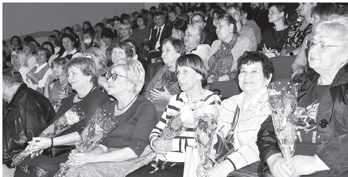
Торжественный приём педагогов района

В ДК «Юбилейный» п. Переяславка состоялся торжественный приём, посвящённый Дню учителя и Дню дошкольного работника.