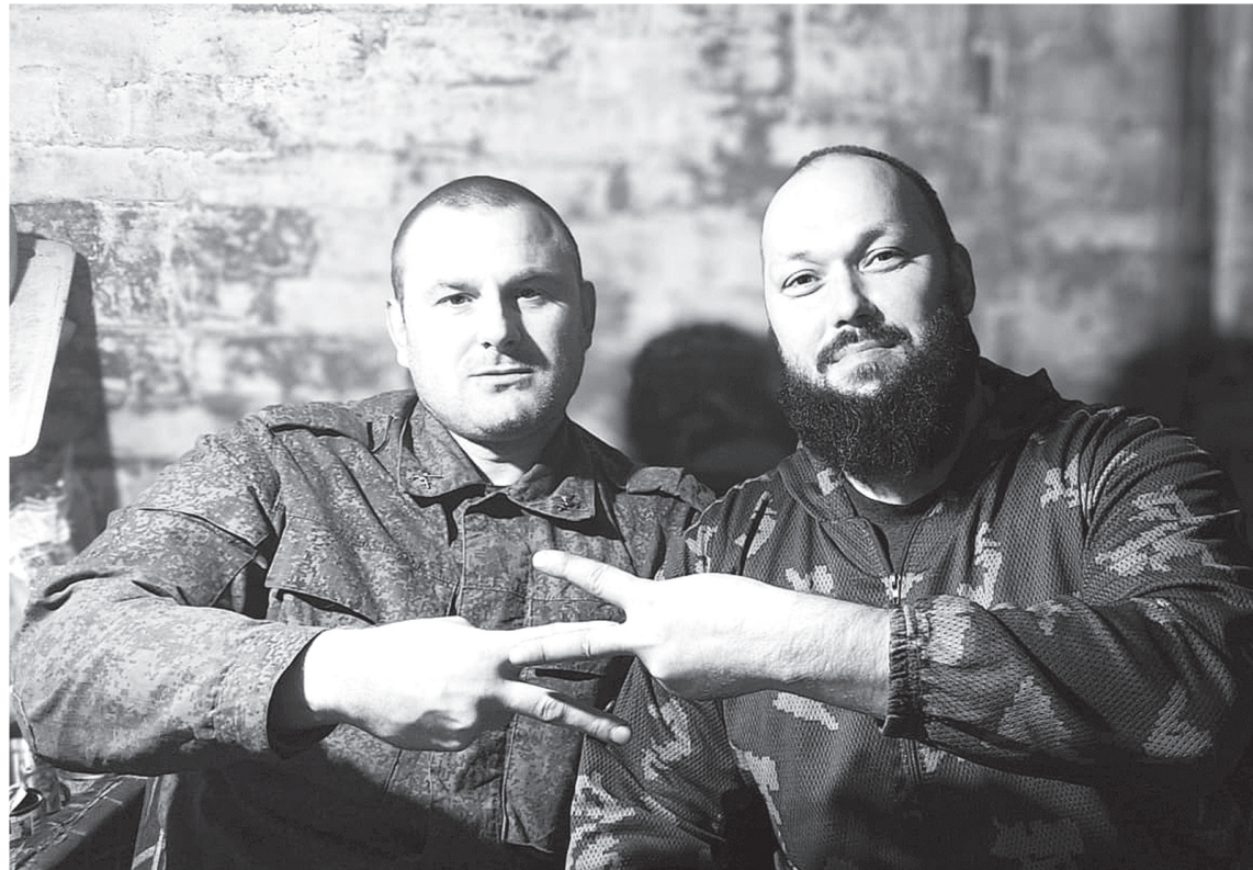
Фронтовой привет лазовским учителям!

– В институте преподаватели не раз нам говорили, что профессия учителя поможет нам быть руководителем в любой