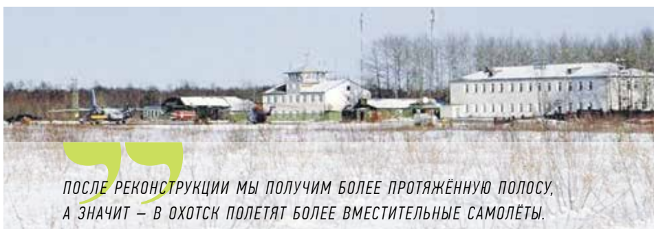
ПОСЛЕ РЕКОНСТРУКЦИИ МЫ ПОЛУЧИМ БОЛЕЕ ПРОТЯЖЁННУЮ ПОЛОСУ, А ЗНАЧИТ – В ОХОТСК ПОЛЕТЯТ БОЛЕЕ ВМЕСТИТЕЛЬНЫЕ САМОЛЁТЫ.

Напомним, помимо Охотска на 2024 год запланирована модернизация аэропорта посёлка Херпучи в районе им. Полины Осипенко с работами стоимостью 1,3 млрд рублей, в планах на 2025 год стоит также воздушная гавань в Аяне с суммой в 900 млн рублей.