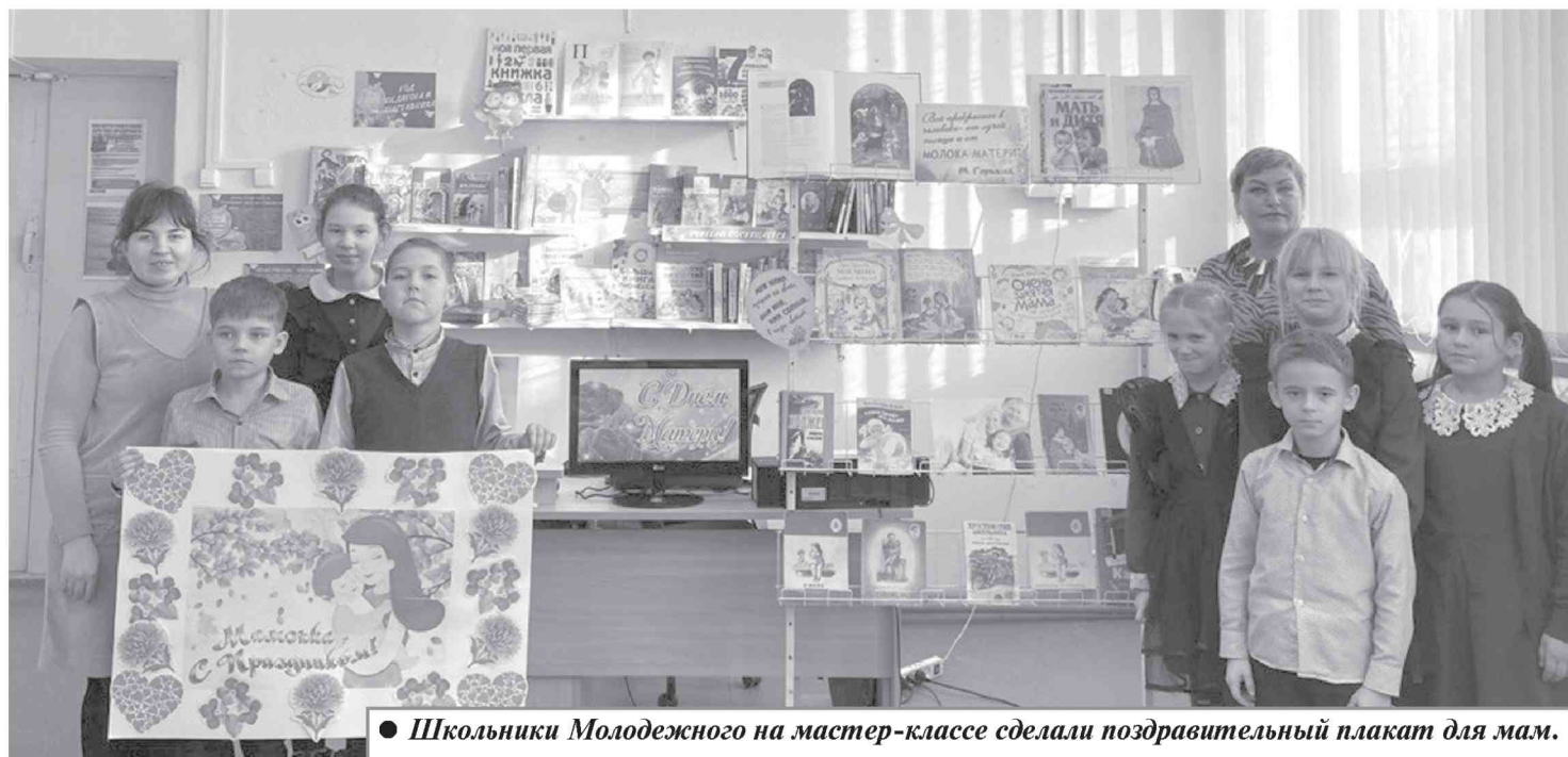
● Школьники Молодежного на мастер-классе сделали поздравительный плакат для мам.