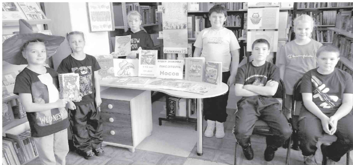
● Участники литературного путешествия — юные читатели библиотеки Селихино.

Л. ПОРОШИНА, библиотекарь Селихинского сельского поселения.