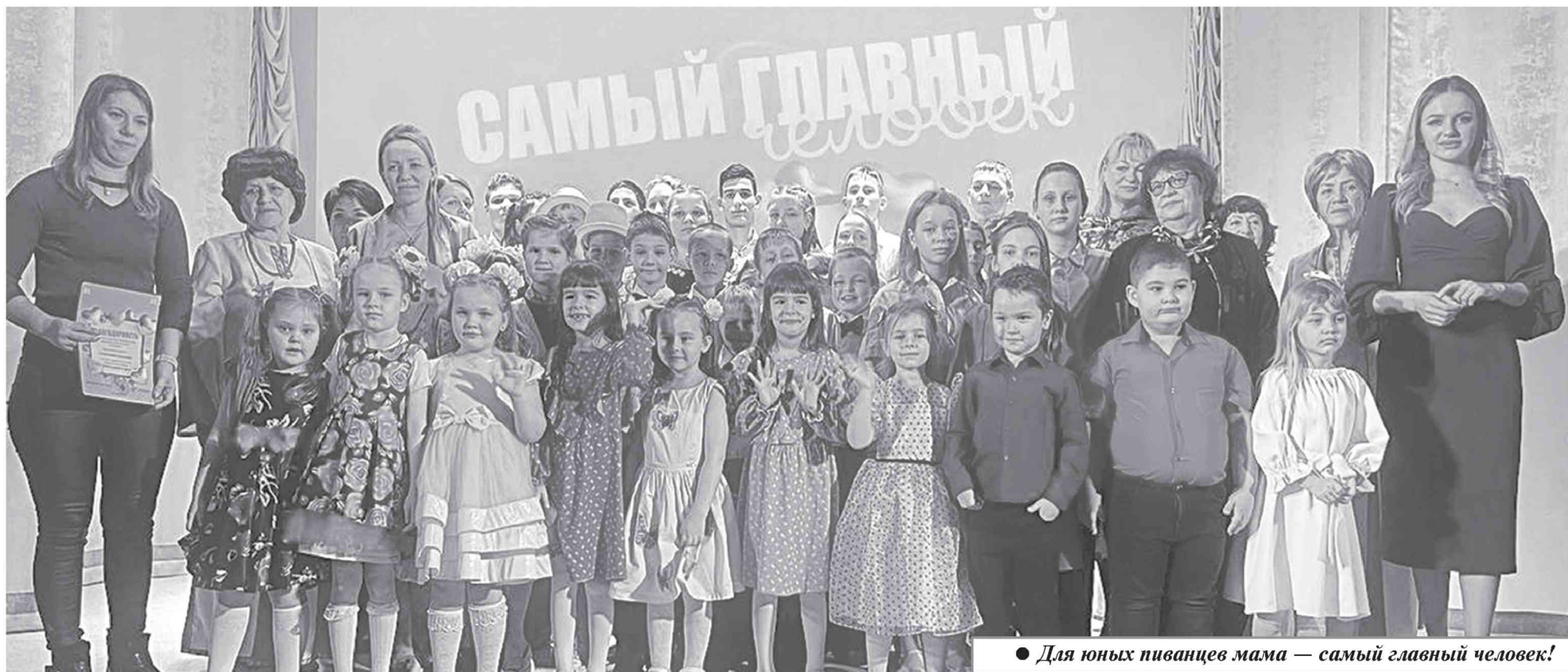
● Для юных пиванцев мама — самый главный человек!