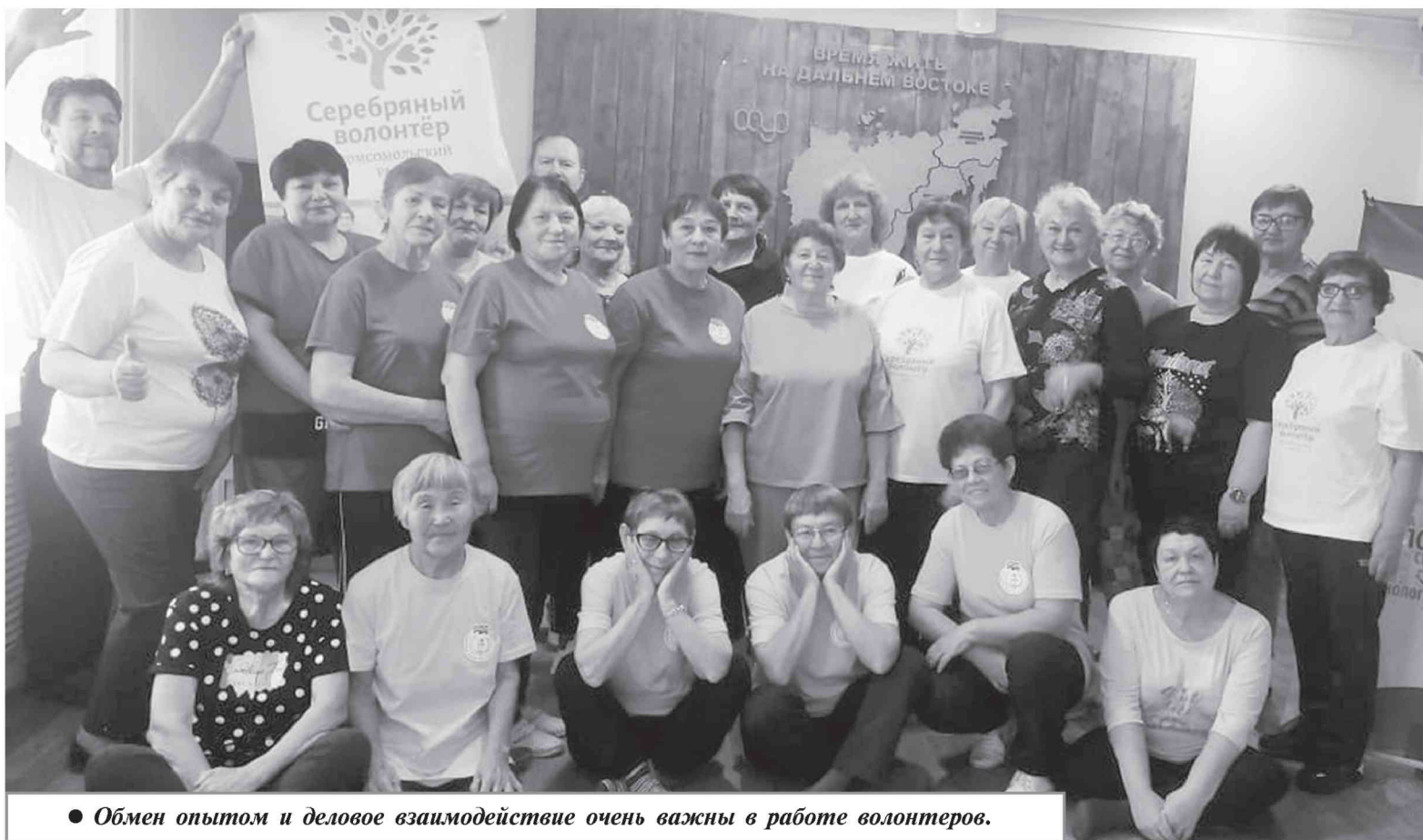
● Обмен опытом и деловое взаимодействие очень важны в работе волонтеров.

Администрация Комсомольского муниципального района Хабаровского края сообщает об оказании имущественной поддержки субъектам малого и среднего предпринимательства, физическим лицам, не являющимся индивидуальными предпринимателями и применяющим специальный налоговый режим «Налог на профессиональный доход», и организациям, образующим инфраструктуру поддержки субъектов малого и среднего предпринимательства в Комсомольском муниципальном районе Хабаровского края, в виде предоставления муниципального имущества, включенного в Перечень, в аренду без проведения конкурсов и аукционов.