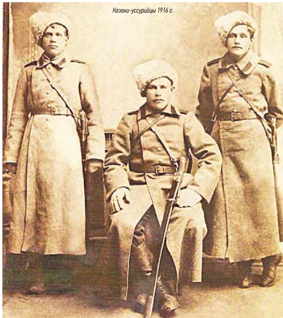
Казачи-уссурийцы 1916 г.

В 1868 году в станице Покровской имелось 17 дворов, жили 87 жителей, из них 29 детей. Из домашнего хозяйства в среднем было 27 лошадей и 17 быков, обрабатывалось 42 десятины земли. По состоянию на 1903 год станица Покровская состояла из 10 дворов. Население составило 64 человека. В 1912 году насчитывалось 23 двора с населением 120 человек.