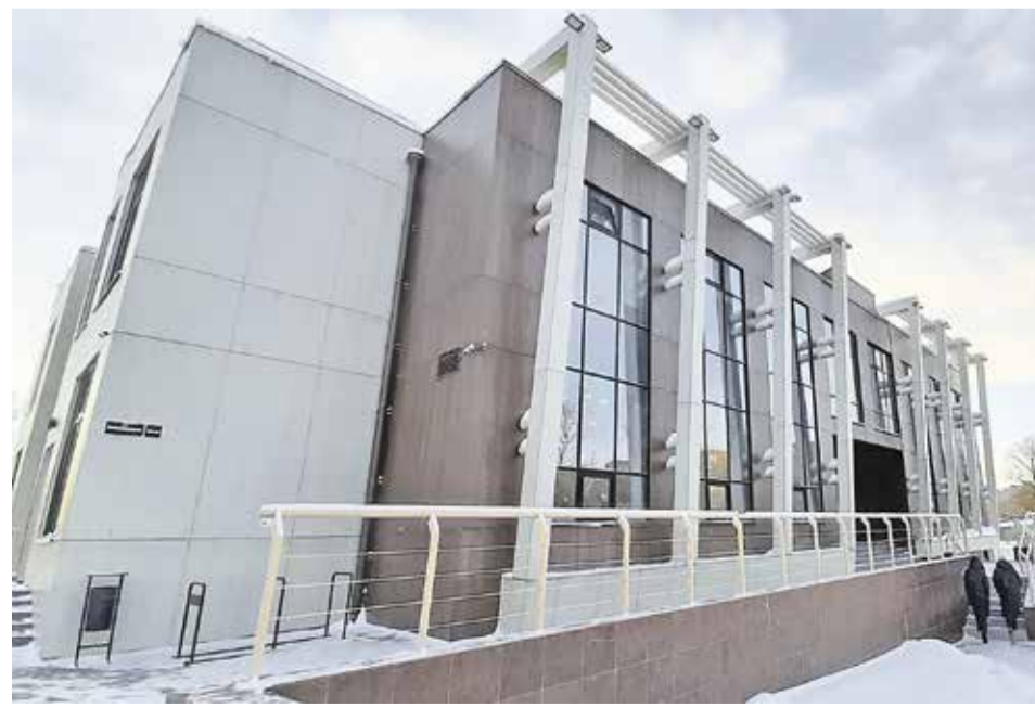
Здание ДВ проектного института