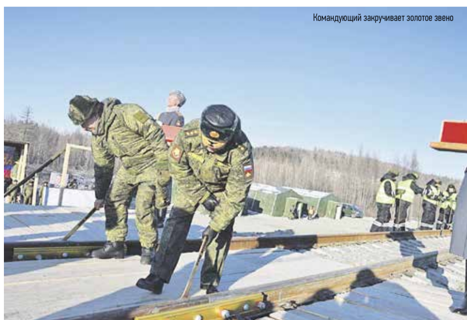
Командующий закручивает золотое звено

И в ближайшее время стройка будет только расширяться. В этом году запланировано начало сооружения двухпутной вставки на перегоне Нальды – Дуссе-Алинь. Это второй путь к новому Дуссе-Алинскому тоннелю. В соседнем Солнечном районе всю развернуто строительство новых железнодорожных мостов.