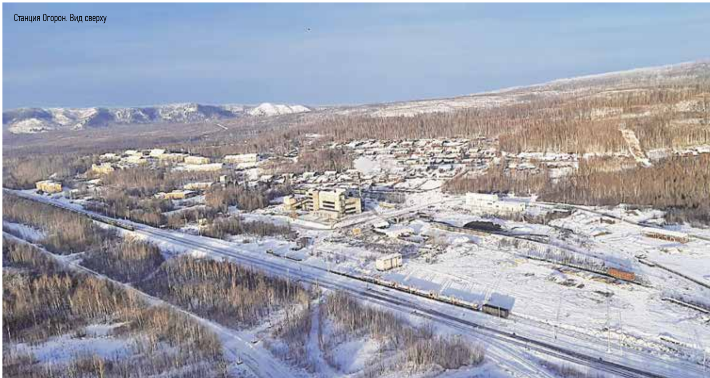
Станция Огорон. Вид сверху