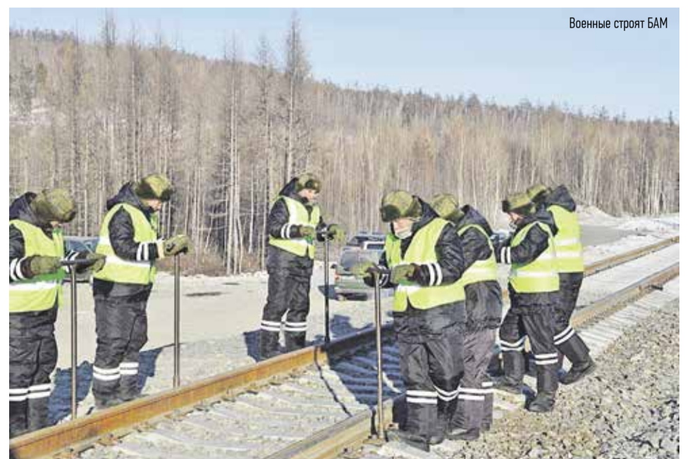
Военные строят БАМ

Военные строители на БАМе работают сверхбыстрыми темпами, выполняя ежедневно свыше 100% от плана. Бла-