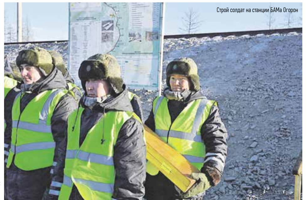
Строй солдат на станции БАМа Огорон