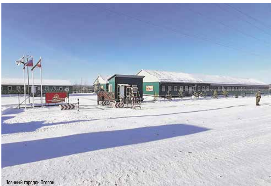
Военный городок Огорон

После вертолёта по проложенным сквозь глухую тайгу автотрассам движемся к месту начала укладки второго пути на перегоне станция Огорон