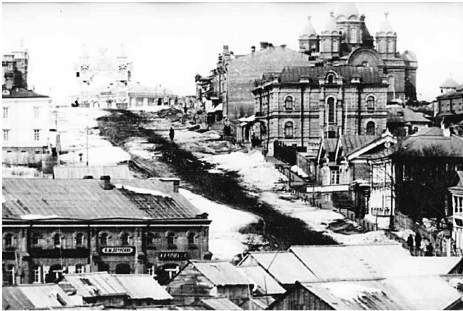
В двухэтажном здании справа размещался Приамурский отдел ГПО ДВР