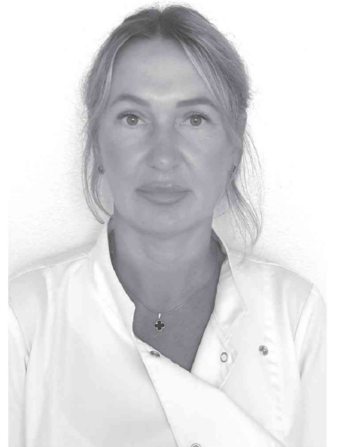
Благодаря данной работе уверена, проблема с дефицитом кадров будет постепенно решаться.

В настоящее время подали документы в медицинский колледж г. Комсомольска-на-Амуре 7 человек, с дальнейшим трудоустройством в Амурскую ЦРБ после завершения обучения.