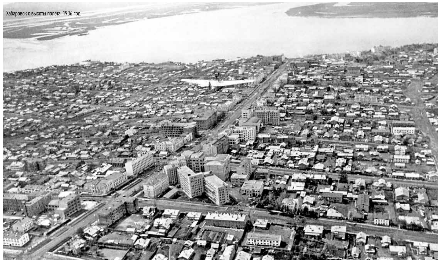
Хабаровск с высоты полета, 1936 год

Мы обернули взгляд на 85 лет назад и узнали в архивах, что в 1938 году – когда Хабаровский край образовался в нынешнем виде – писали о юбилее краевой столицы.