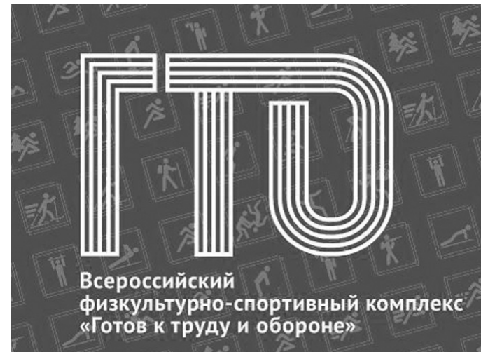
Всероссийский физкультурно-спортивный комплекс «Готов к труду и обороне»

И далеко не секрет, что регулярные занятия спортом - это поддержание оптимальной физической формы, эффективный способ повышения иммунного статуса организма и хорошая профилактика заболеваний.