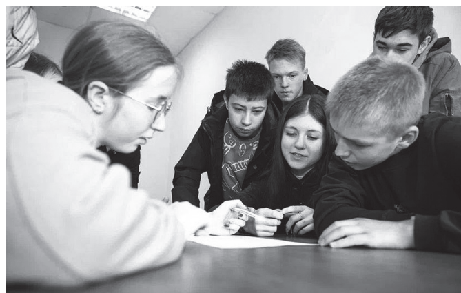
Викторина «Страницы истории Отечества» заставила призадуматься.

Игра прошла азартно и интересно, школьники с пользой провели время. Каждый из участников на деле понял, что такое один за всех и все за одного!