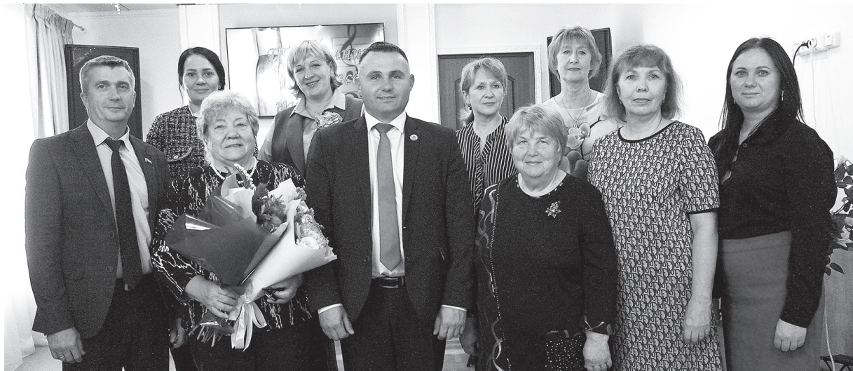
С уважением и признательностью от руководства района и коллег