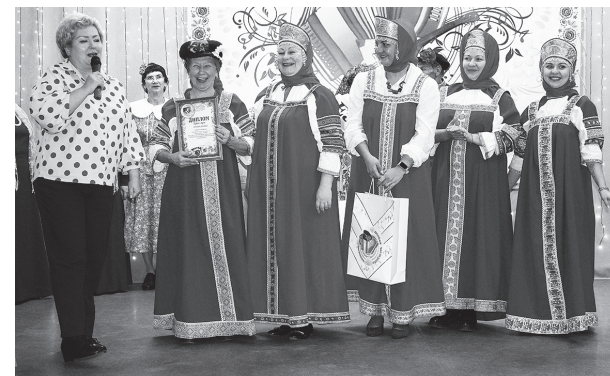
«Матрены» из Бичевой – с картузом и Гран-при

Кроме того, у каждого была возможность поучаствовать в беспроигрышной лотерее, которую вместе с выставкой творческих работ подготовили мастерицы из творческого объединения «Рукотворушки», а также сделать яркие фото в специально подготовленных фотозонах.