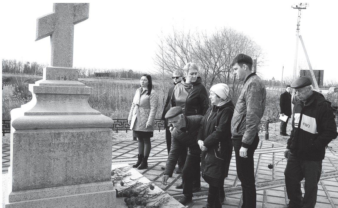
У Поклонного креста – алые гвоздики от лазовцев.

нию наше прошлое, напротив, его нужно помнить и знать для того, чтобы преступления такого масштаба и такой жестокости не повторялись. Помнить не только ради тех, кто прошел через эти испытания, но и ради всех нас: события тех лет – это