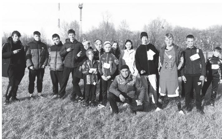
Команда ХСШ № 3

На старт вышли 90 ребят из ХСШ №2 и №3, СШ п. Но-