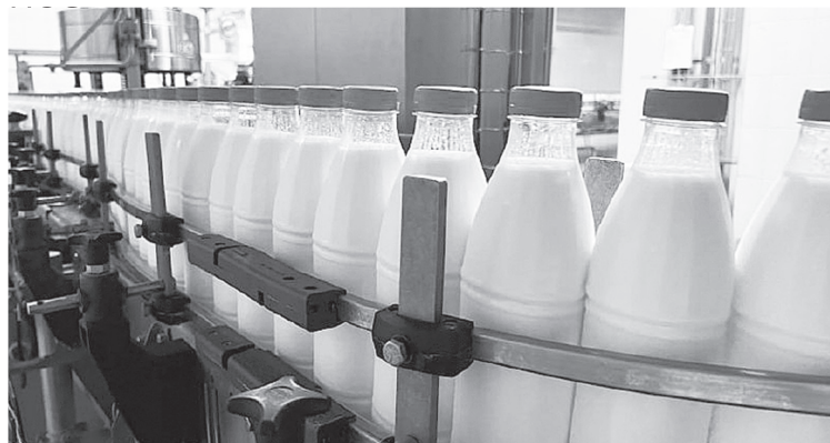
Линия пастеризованного молока

Последними новинками, которыми комбинат порадовал своих покупателей в этом году, стали легкие освежающие пастеризованные напитки на сыворотке мажигель с различными фруктовыми вкусами, 9-процентный лазовский творог в упаковке по 300 гр. и цельное отборное молоко жирностью от 3,6% до 6%.