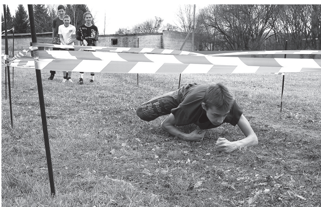
Ползком к победе