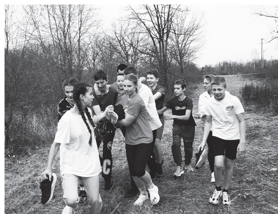
Транспортируем «раненого» бережно.