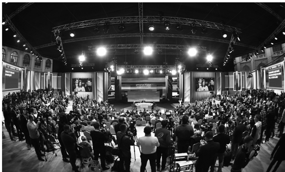
Число обращений к главе государства превысило 2 млн. Вопросы, которые не удалось затронуть в ходе прямой линии, в течение года будут обрабатываться Общероссийским народным фронтом при участии глав регионов.

Добавим, что в ходе прямой линии Владимир Путин также заявил, что Правительство РФ полностью выполняет и будет выполнять свои обязательства перед гражданами, несмотря на повышение расходов на оборонку. Кроме того, были затронуты вопросы, касающиеся отношений России со странами Запада, развития российско-китайских отношений, развития отечественного самолетостроения, транспортной доступности Дальнего Востока, поддержки МСП, а также отраслей спорта, ЖКХ, здравоохранения, социальной сферы и другие.