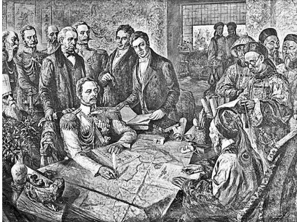
Подписание Айгунского договора. Художник В. Романов

Первые казаки объявились в Китае в 1567 году. Известны их фамилии – Иван