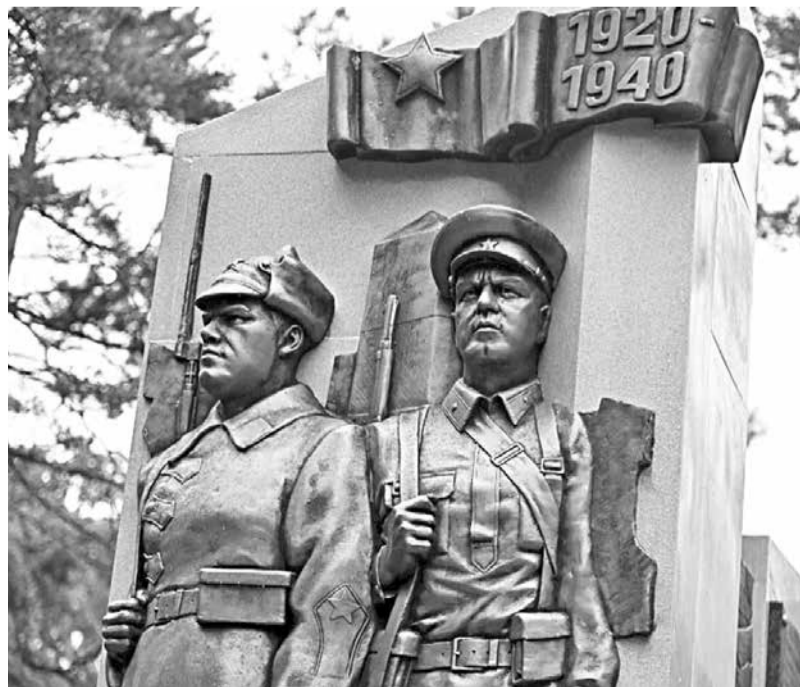
Аллея пограничной славы на Уссурийском бульваре в Хабаровске