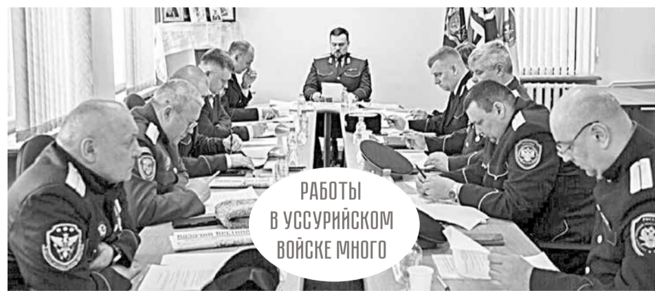
РАБОТЫ В УСУРИЙСКОМ ВОЙСКЕ МНОГО