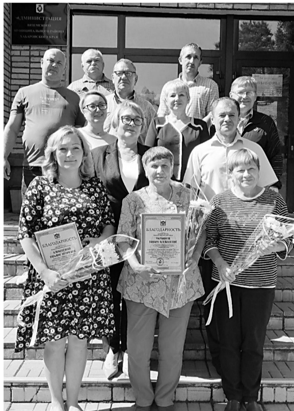
Депутаты районного Собрания плодотворно работали с исполнительной властью в течение пяти лет

В Вяземском прошло завершающее Собрание депутатов муниципального района.