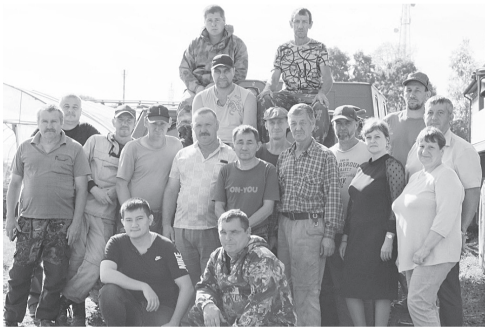
Работники КГАУ «Аванское лесное хозяйство» не только оберегают леса от пожаров, но и выращивают сеянцы хозяйственно - ценных пород для проведения лесовосстановительных работ

По инициативе губернатора Хабаровского края Михаила Дегтярёва, для сохранения природного богатства, к 2030 году в нашем крае предстоит удвоить количество выращиваемых саженцев лесных культур. В этом направлении уже активно работают сотрудники КГАУ «Аванское лесное хозяйство».