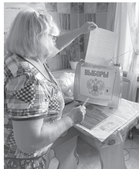
К 512 жителям района избирательные комиссии осуществили выезд на дом