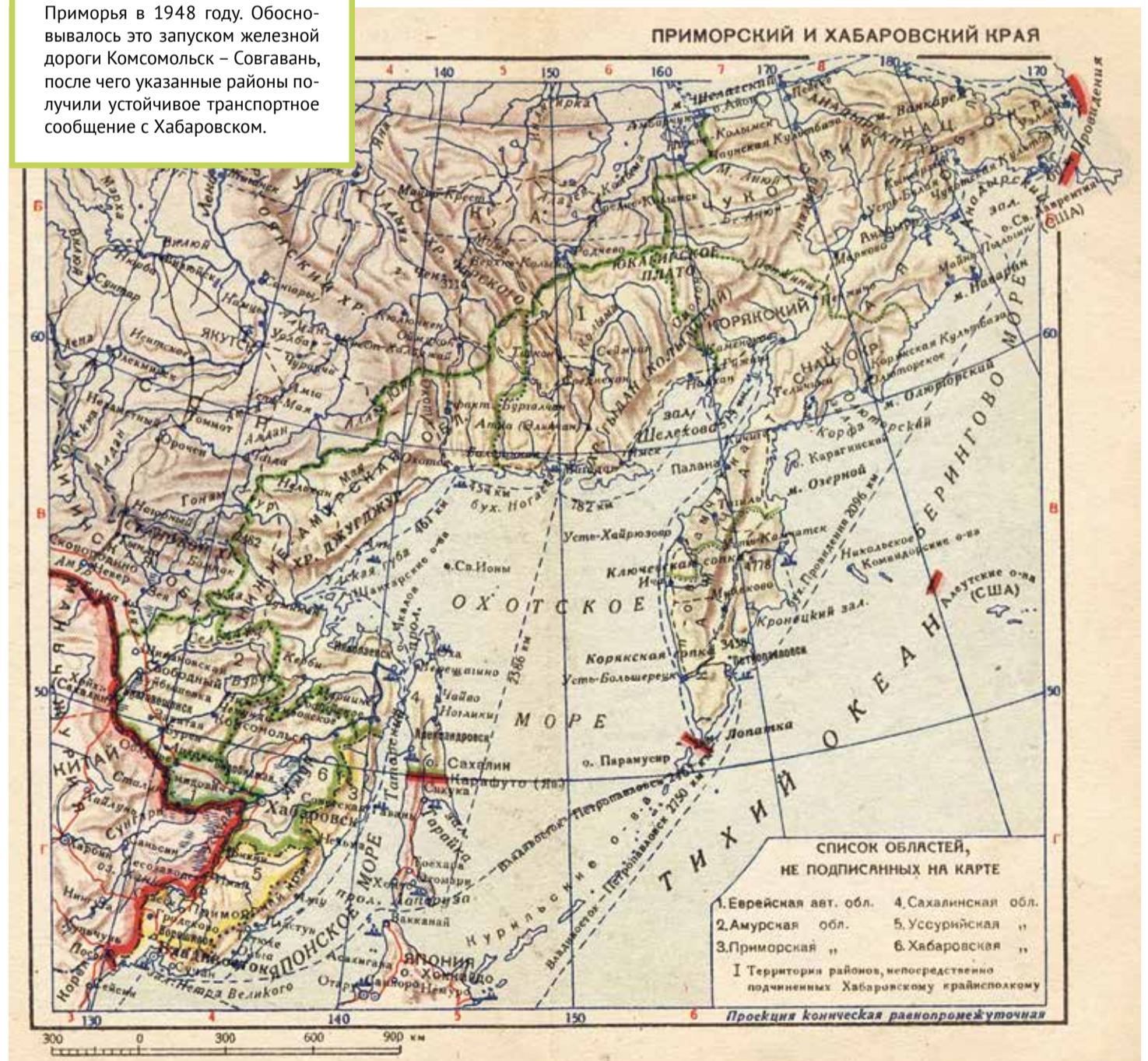
Карта приморского и хабаровского краёв 1939 года

И тем не менее, после всех этих преобразований Хабаровский край остался одним из крупнейших регионов РФ — 4-е место после Якутии, Красноярского края и Тюменской области.