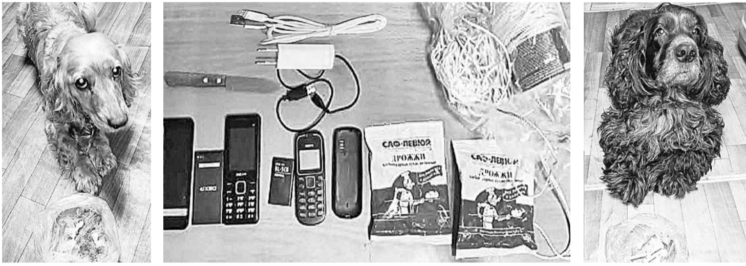
В ФКУ ИК-1 и СИЗО-2 при досмотре посылок, передач с применением специальных собак обнаружены спрятанные изощрёнными способами наркотические вещества

Недавно в районе имени Лазо суд приговорил к трём годам лишения свободы 23-летнего хабаровчанина, который пытался передать своему знакомому в изолятор временного содержания наркотическое средство. «Умелец» спрятал наркотик в пакет, который поместил в бутылку с шампунем. Запрещённое вещество обнаружили при досмотре передачи и изъяли.