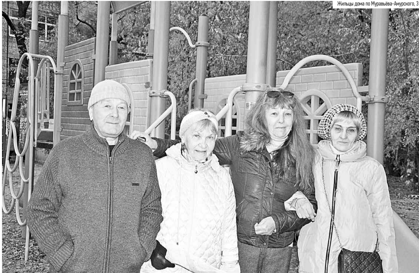
Жильцы дома по Муравьёва-Амурского, 31

Что делать, если двор вашего дома вдруг огораживают строительным забором, сносят детскую площадку и лишают жильцов парковочных мест, чтобы воткнуть рядом очередную «свечку»? С такой ситуацией столкнулись собственники одного из МКД в самом центре Хабаровска.