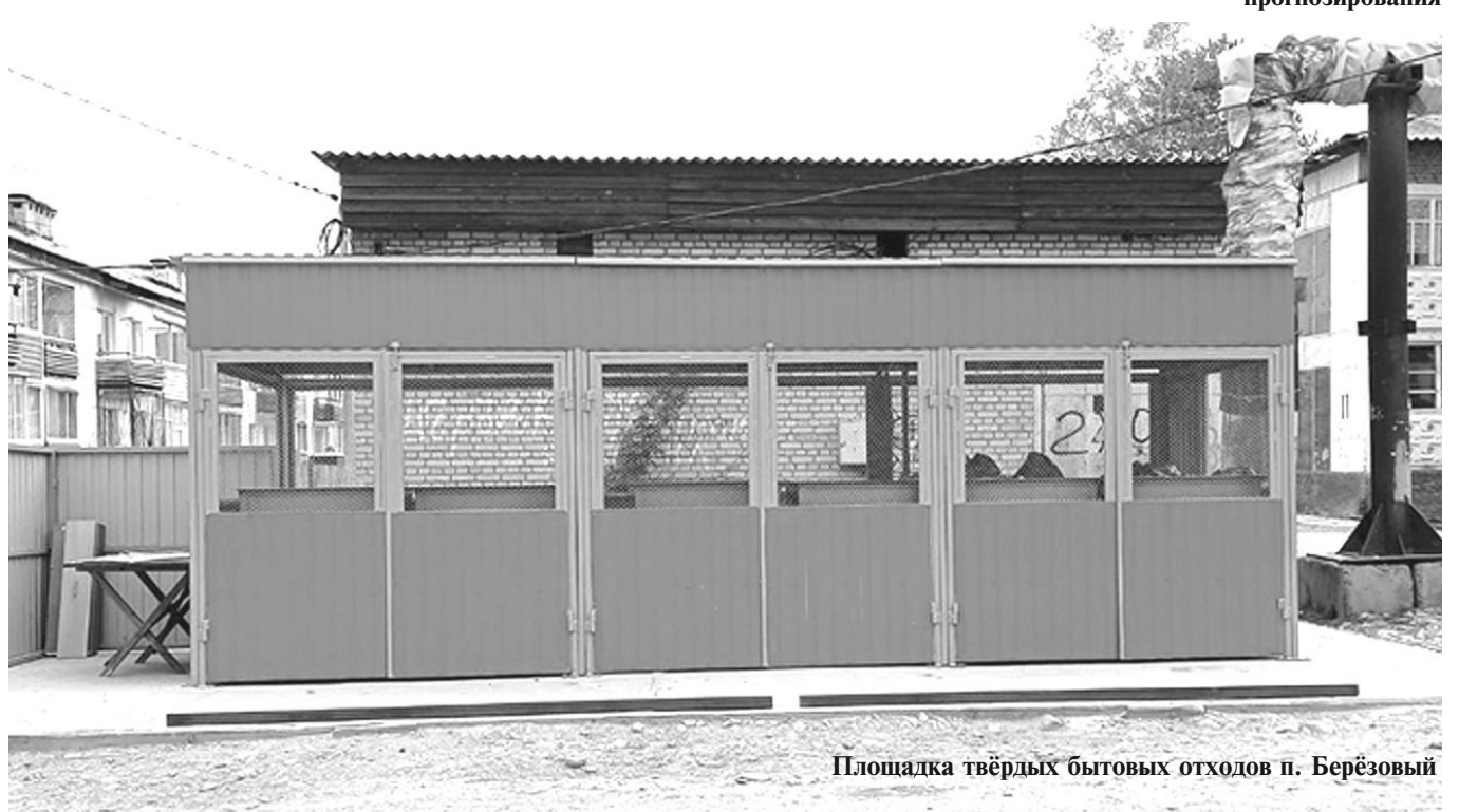
Площадка твёрдых бытовых отходов п. Берёзовый