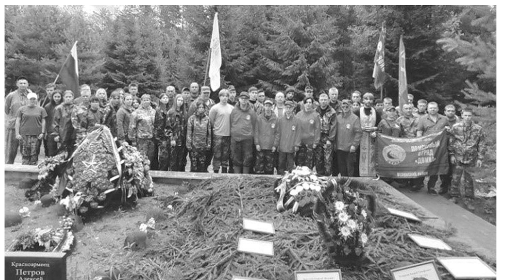
Поисковый отряд «Двина». г. Велиж Смоленской области