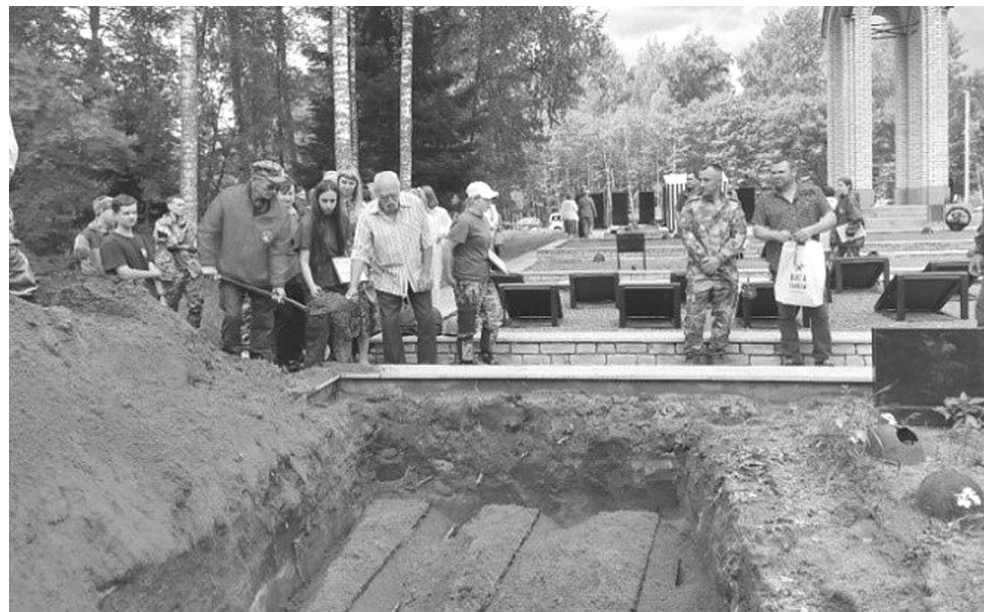
Фото с мест захоронения