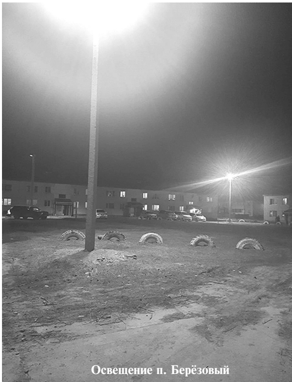
Освещение п. Берёзовый