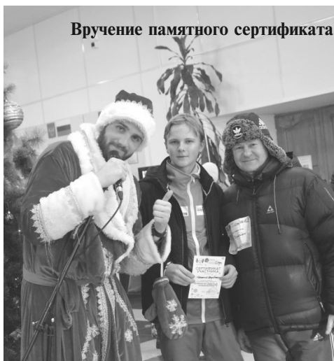
Вручение памятного сертификата