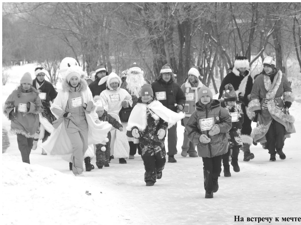
На встречу к мечте