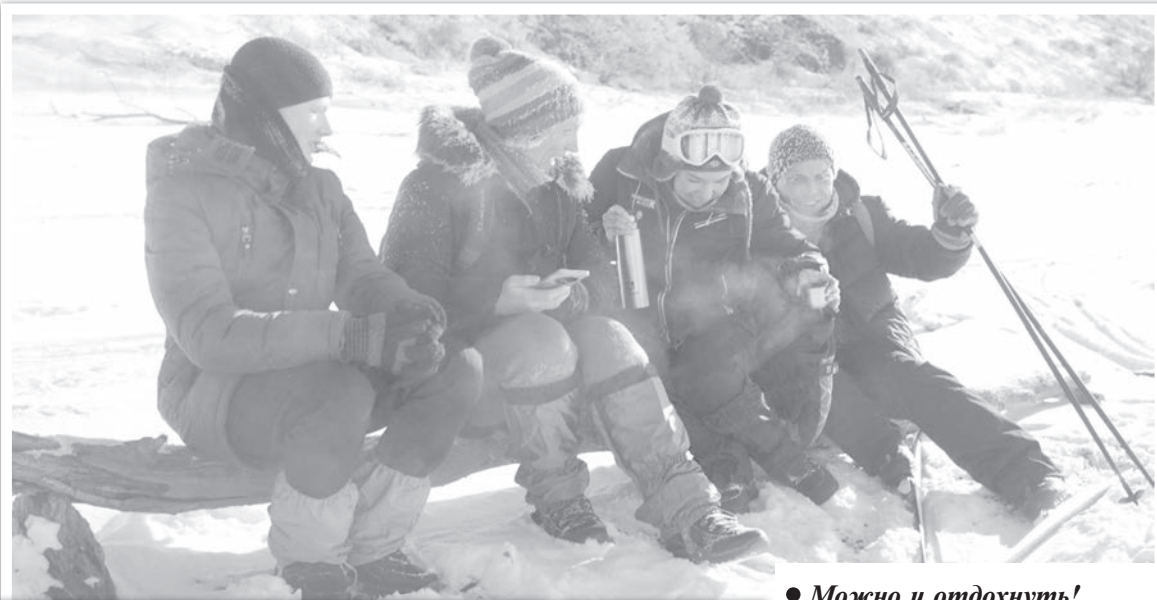
● Можно и отдохнуть!

Кстати, одними из первых гостей фотовыставки