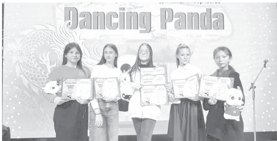
● Лауреаты международного конкурса «Танцующий Панда».

МБУК Дом культуры сельского поселения «Поселок Молодежный».