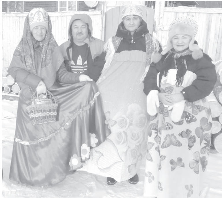
● Ряженые исполняли «колядки» и дарили подарки.

Уже не один год в селе Боктор существует замечательная традиция — поздравлять односельчан с наступающим Новым годом, а в начале января с Рождеством.