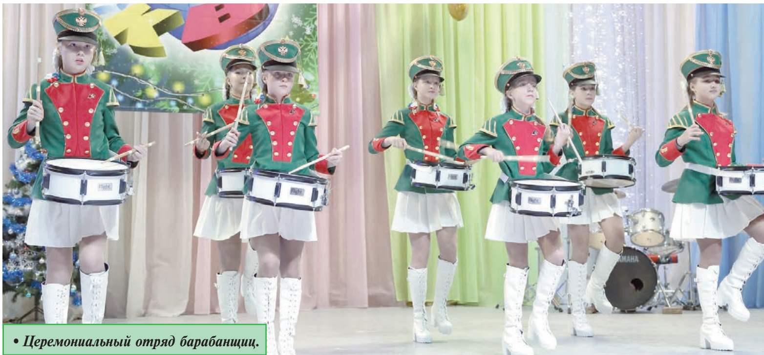
• Церемониальный отряд барабанищиц.