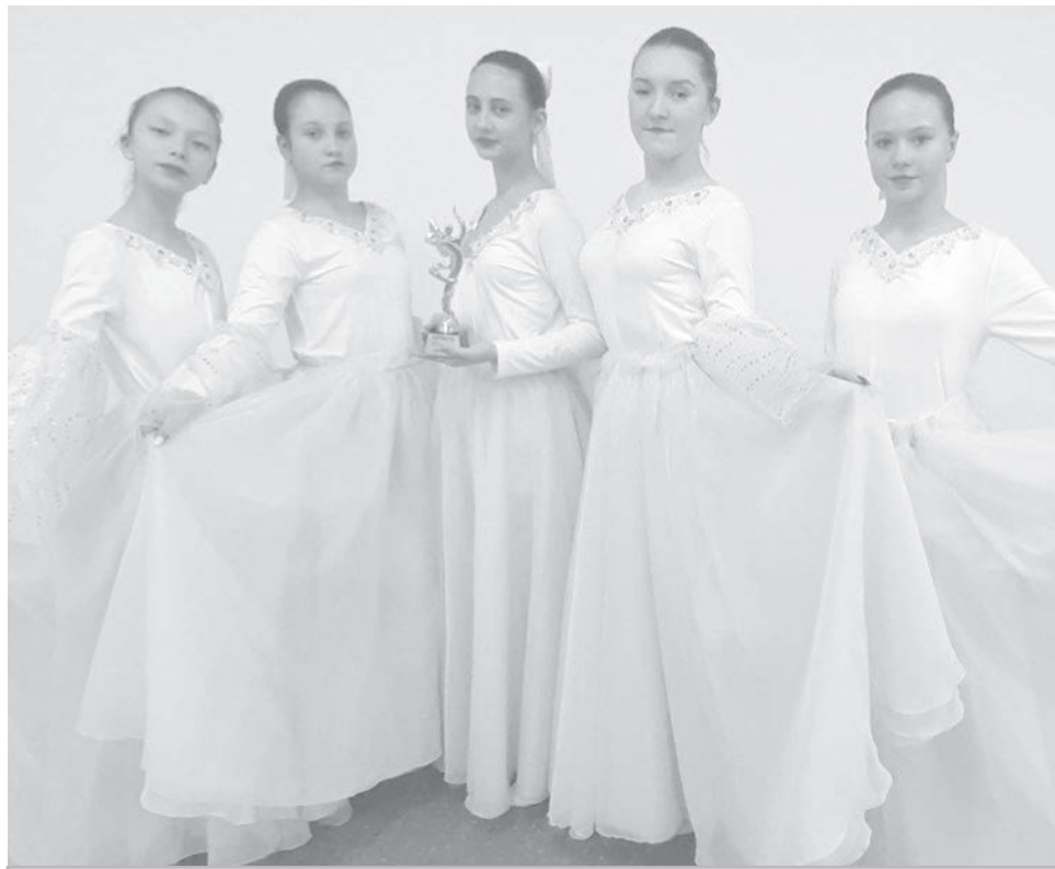
● Выступление хореографического коллектива «Экспрессия».

«Золото» и «серебро» завоевали участницы хореографического коллектива «Экспрессия» поселка Молодежный на международном конкурсе «Танцующий Панда».