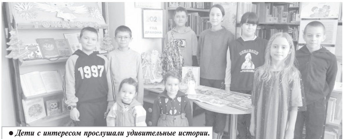
● Дети с интересом прослушали удивительные истории.

В череде зимних праздников Рождество Христово имеет особое значение. Оно несет веру в лучшее, любовь к людям и жизни, к ее вечному обновлению. В библиотеке Селихинского сельского поселения подготовили сразу несколько праздничных мероприятий, посвященных этому необыкновенному событию.