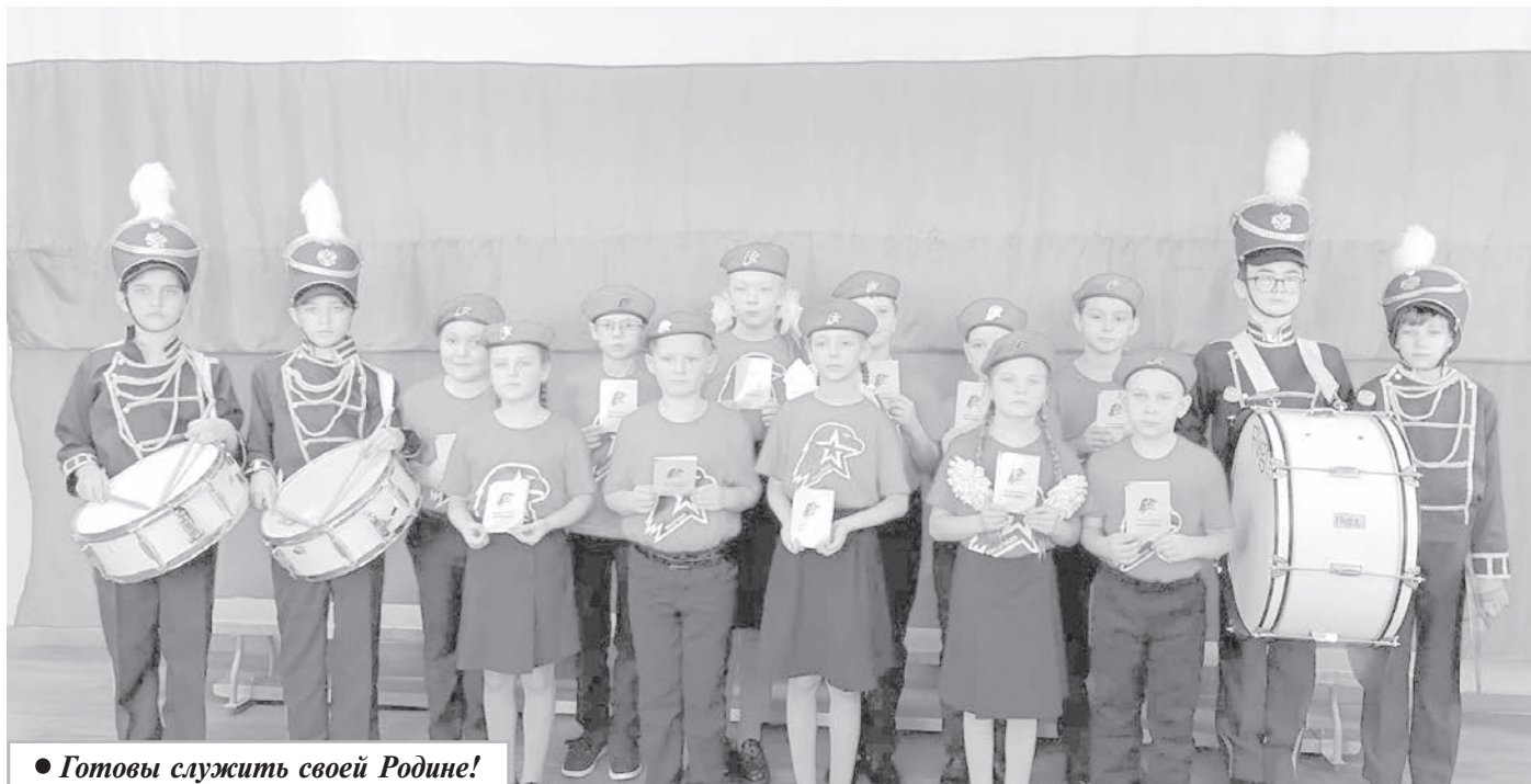
● Готовы служить своей Родине!