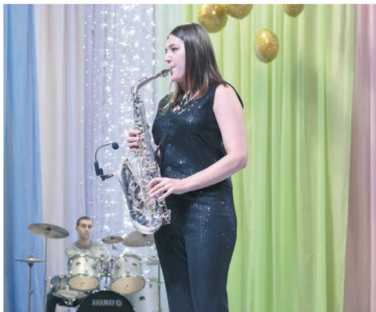
• Музыкальный номер военного оркестра.