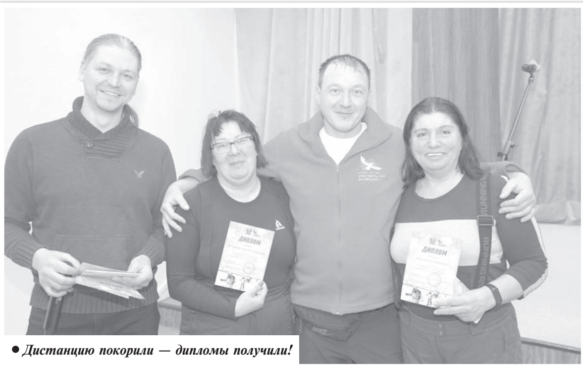
● Дистанцию покорили — дипломы получили!

На финише, в Доме культуры села Верхняя Эконь, участников перехода ждала вкусная уха, небольшой концерт и ярмарка продукции местных мастеров. За участие в переходе руководитель