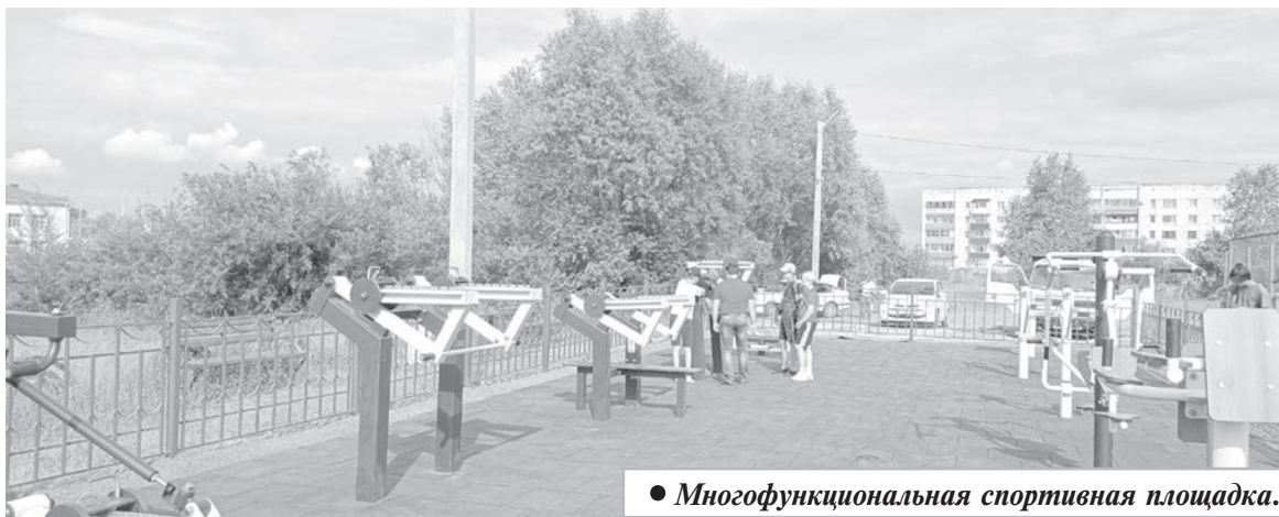
• Многофункциональная спортивная площадка.

По информации администрации Комсомольского муниципального района.