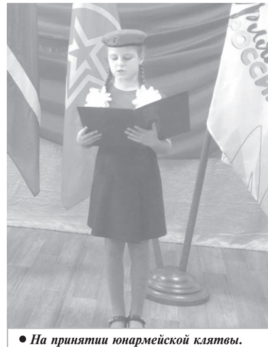
● На принятии юнармейской клятвы.