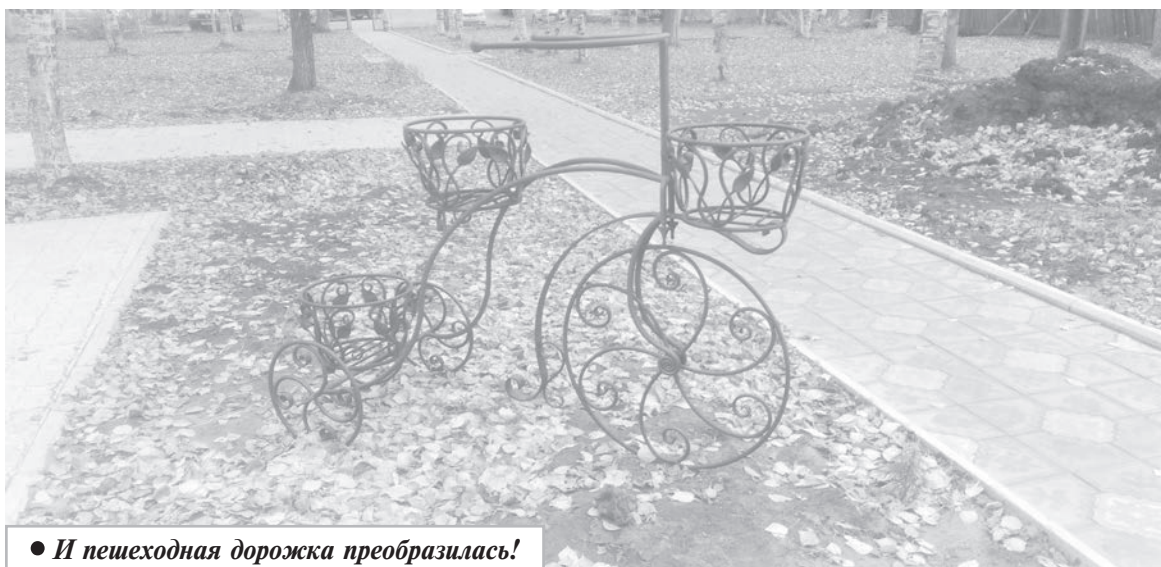
• И пешеходная дорожка преобразилась!