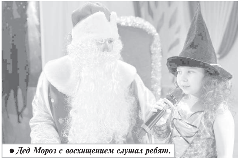
● Дед Мороз с восхищением слушал ребят.

Как известно, преддверие праздника порой доставляет больше эмоций, чем сам праздник, особенно если речь идет о новогодней ночи.