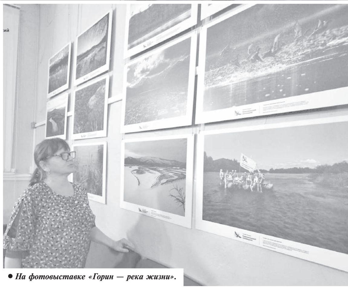
● На фотовыставке «Горин — река жизни».

А. СТЕПАНОВА, специалист по связям с общественностью филиала Комсомольский ФГБУ «Заповедное Приамурье».