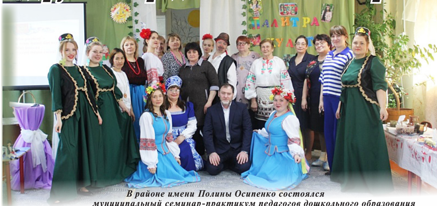
В районе имени Полины Осипенко состоялся муниципальный семинар-практикум педагогов дошкольного образования «Палитра культур в контексте культурных и семейных традиций». Мероприятие прошло 27 марта на базе Детского сада села Бриакан.

2024 год в России, согласно указу Президента РФ, объявлен Годом семьи. На мой взгляд, это не случайно, ведь счастливая семья – залог жизнеспособности общества. Семья остается практически единственным и самым действенным институтом, сохраняющим и передающим по наследству последующим поколениям все то прекрасное, что накопилось в веках. И каждый народ, каждая национальность передает этот опыт, опираясь на свои традиции. Узнавая обычаи и традиции народов, живущих рядом, мы учимся больше понимать друг друга. Ведь сосед, которого ты знаешь, становится ближе, понятней. Добрососедские отношения, заложенные в семье в раннем возрасте, способствуют формированию крепкого здорового общества.