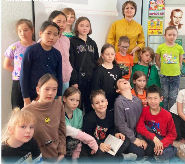
Во время весенних каникул при школах района имени Полины Осипенко действовали оздоровительные лагеря отдыха с дневным пребыванием детей.

школе села им. П. Осипенко, для работы с детьми здесь были задействованы все педагоги. Ребята выполняли физические упражнения, знакомились с техникой безопасности, играли на свежем воздухе.