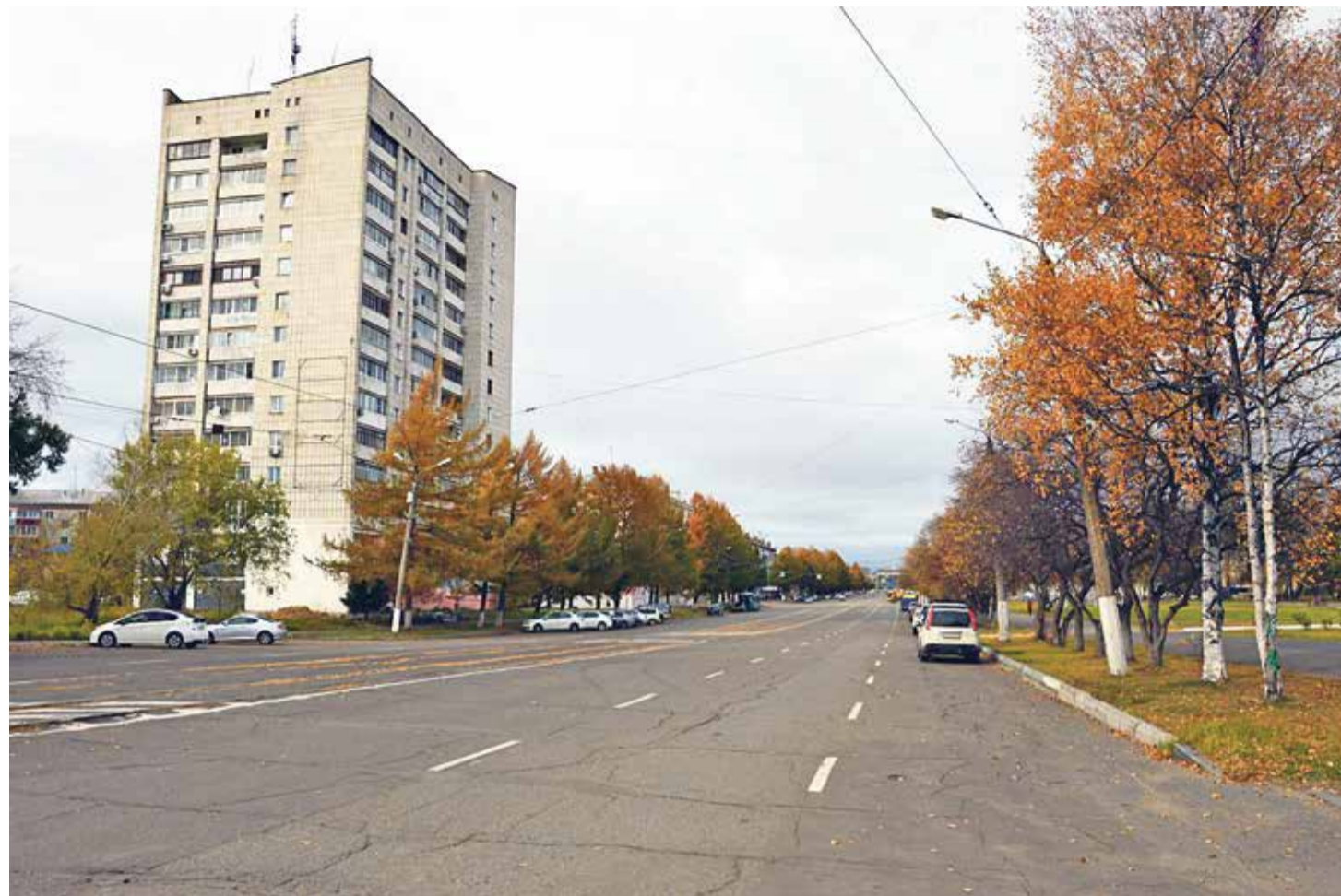
Фото: Андрей Вотинков

Теплый отклик оставался от принимающих съёмочную группу местных жителей. Оказывается, что в некоторых поселениях съёмочных групп не видели уже более 10-15 лет, а ведь местным есть что рассказать и показать. Поэтому люди охотно участвовали в съёмках и благодарили за вышедшие в эфир выпуски программы.