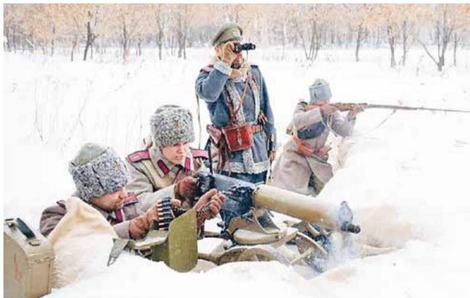
Реконструкция к столетию знаменитых Волочаевских боёв в феврале 1922 г.

“ ОБЩИЕ ПОТЕРИ ЗА ТРИ ДНЯ ВОЛОЧАЕВСКОЙ БИТВЫ ДОСТИГЛИ БОЛЕЕ 2200 УБИТЫМИ И РАНЕНЫМИ. «КРАСНЫЕ» РАПОРТОВАЛИ ЕЩЁ И О 200 ОБМОРОЖЕННЫХ БОЙЦАХ. ”