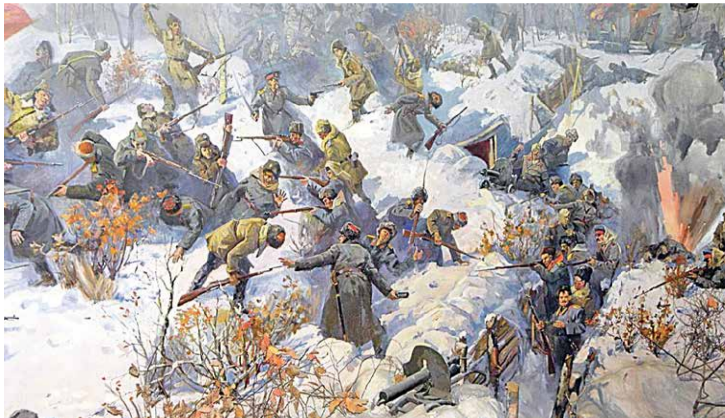
Панорама Волочаевской битвы в хабаровском краевом музее имени Н.И. Гродекова

Блюхер объявил мобилизацию, свежие части отправил на линию фронта. Первую успешную операцию солдаты Народно-революционной армии ДВР провели 28 декабря 1921 года – они отразили штурм