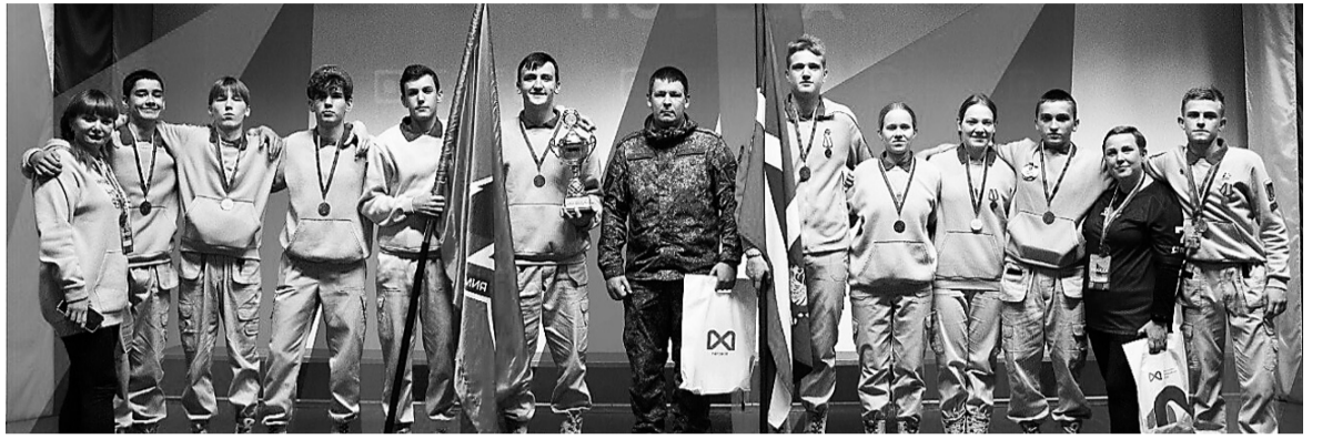
Команда «Истоки» Хабаровского района

Военно-спортивная игра «Победа» проводится в России уже более 20 лет. Она продолжает традиции легендарной «Зарницы», на которой выросло несколько поколений настоящих патриотов. Современная военно-спор-