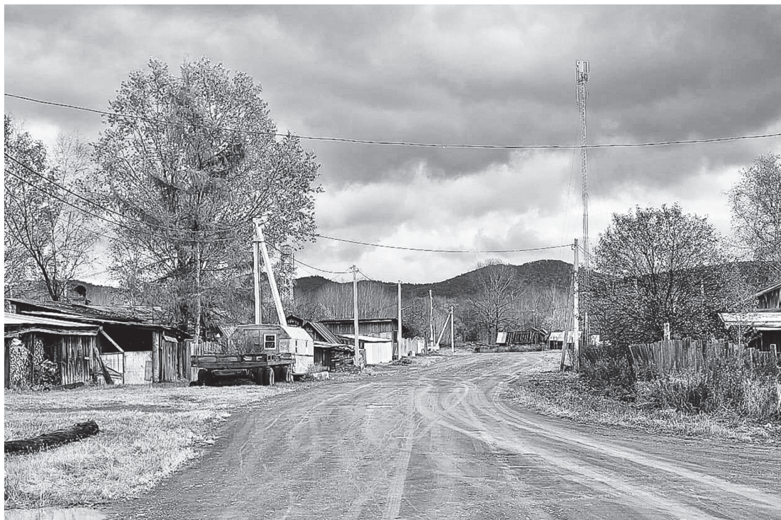
Скоростной Интернет и свет на улицы пришли в Солонцовый.

О качественной связи и Интернете без перебоев жители мечтали давно, но из-за отдалённости и малой численности населения ведущие мобильные операторы не спешили в Долминское поселение. Дело сдвинуть с мертвой точки удалось