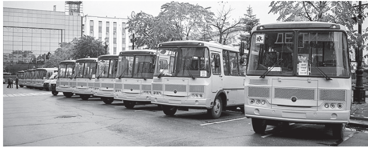
В районе для подвоза в школы более тысячи учеников задействовано 27 школьных автобусов.

Новые автобусы также соответствуют современным техническим требованиям. Сиденья оборудованы ремнями безопасности, дополнительная ступенька поможет подняться в автобус даже самым маленьким пассажирам. В салоне размещены кнопки экстренной связи с водителем.