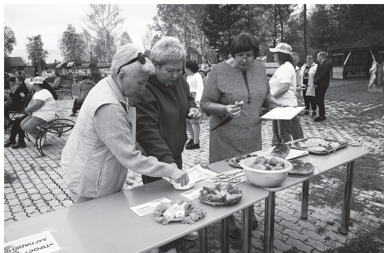
Жюри в сомнениях: «Вкусно или очень вкусно?»

Фестиваль продолжался до позднего вечера. Не обращая внимания на сырую и ветреную погоду, гости пели и танцевали с артистами дотемна, выражая организаторам пожелание в будущем году вновь собраться на замечательном рыбацком празднике.