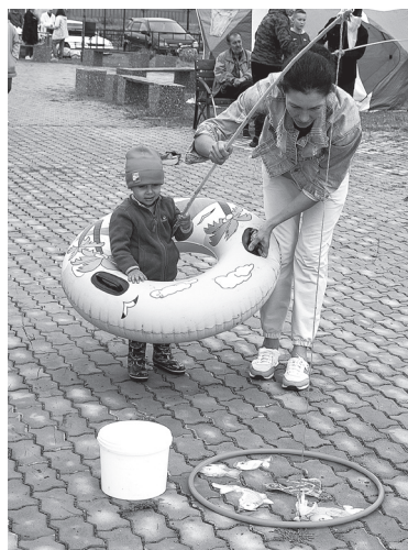
«Ловись, рыбка, большая и маленькая!»