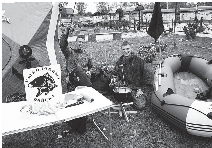
«Рыболовные войска» готовят уху и побеждают.