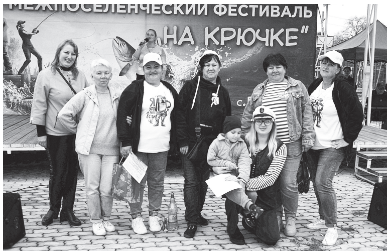
«Мы все хотим приехать вновь сюда!»