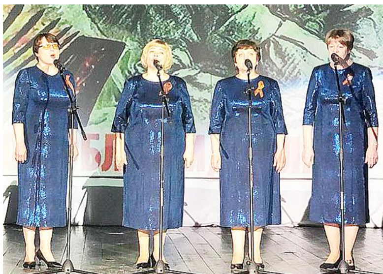
Выступает вокальная группа "Зимняя вишня"

В 2024 году наша страна отмечает 79-ю годовщину Победы в Великой Отечественной войне. В преддверии этого значимого для многих поколений россиян праздника в районном Доме культуры прошёл фестиваль военной песни "О Родине, о доблести, о славе".