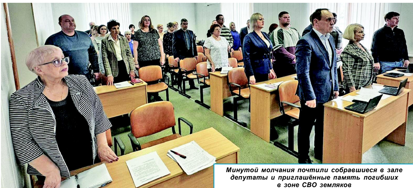
Минутой молчания почтили собравшиеся в зале депутаты и приглашённые память погибших в зоне СВО земляков