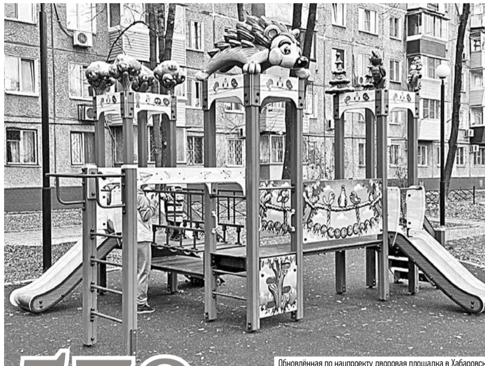
Обновлённая по нацпроекту дворовая площадка в Хабаровске

К оформлению новых парков и цветников прикладывают талант и мастеровитые руки дизайнеры — среди тех