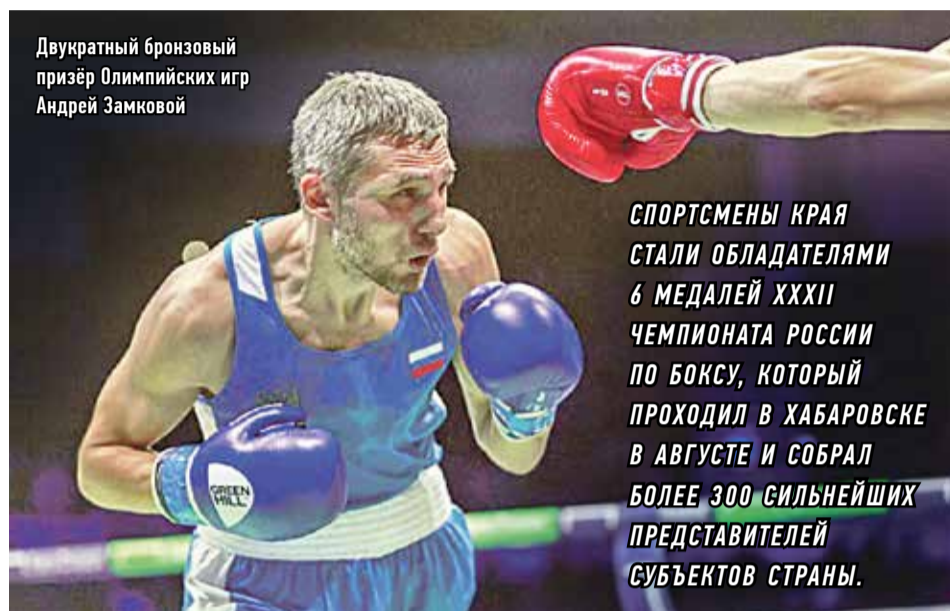
Двукратный бронзовый призёр Олимпийских игр Андрей Замков

Уходящий год стал для Хабаровского края весьма богатым на спортивные события: это и обновление составов команд, и россыпи медалей, которые добыли наши спортсмены на соревнованиях самых разных уровней. Мы решили вспомнить наиболее значимые, на наш взгляд, события из мира спорта нашего региона.