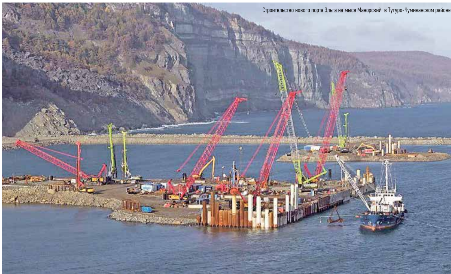
Строительство нового порта Эльга на мысе Манорский в Тугуро-Чумиканском районе