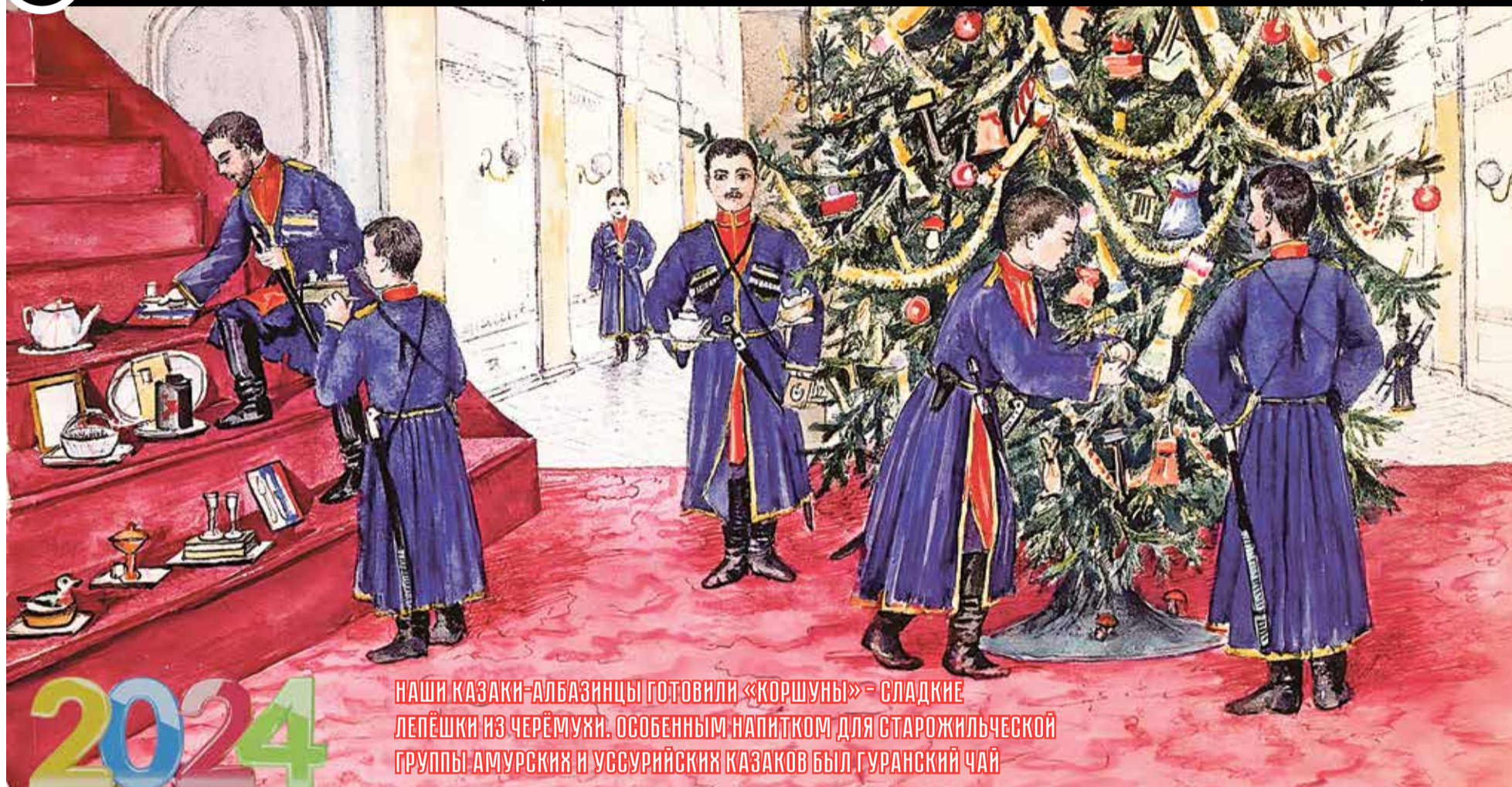
НАШИ КАЗАКИ-АЛБАЗИНЦЫ ГОТОВИЛИ «КОРШУНЫ» - СЛАДКИЕ ЛЕПЁШКИ ИЗ ЧЕРЕМУХИ. ОСОБЕННЫМ НАПИТКОМ ДЛЯ СТАРОЖИЛЬЧЕСКОЙ ГРУППЫ АМУРСКИХ И УССУРИЙСКИХ КАЗАКОВ БЫЛ ГУРАНСКИЙ ЧАЙ

ГАЗЕТА ОКРУЖНОГО КАЗАЧЬЕГО ОБЩЕСТВА ХАБАРОВСКОГО КРАЯ УССУРИЙСКОГО ВОЙСКОВОГО КАЗАЧЬЕГО ОБЩЕСТВА