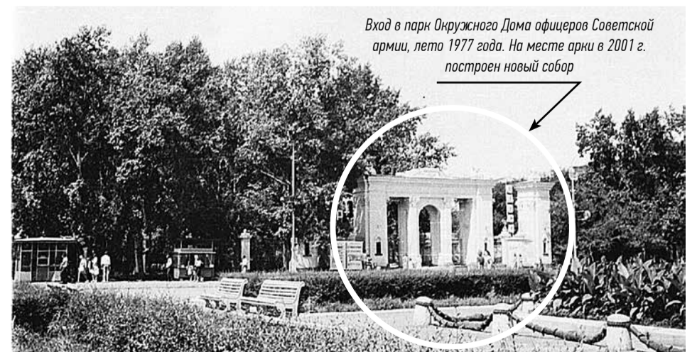
Вход в парк Окружного Дома офицеров Советской армии, лето 1977 года. На месте арки в 2001 г. построен новый собор