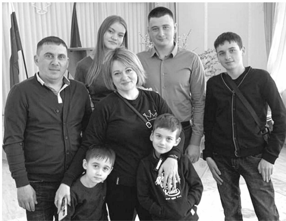
Семья Джуманиязовых. Женили старшенького...