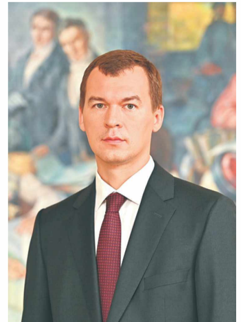
Губернатор Хабаровского края Михаил Дегтярёв

С самого начала специальной военной операции и граждане, и крупные организации включились в её поддержку. Наши предприятия обеспечивают защитников необходимой техникой: от боевых самолётов и корветов до маскировочных средств и тактических автовездеходов "Ерофей".