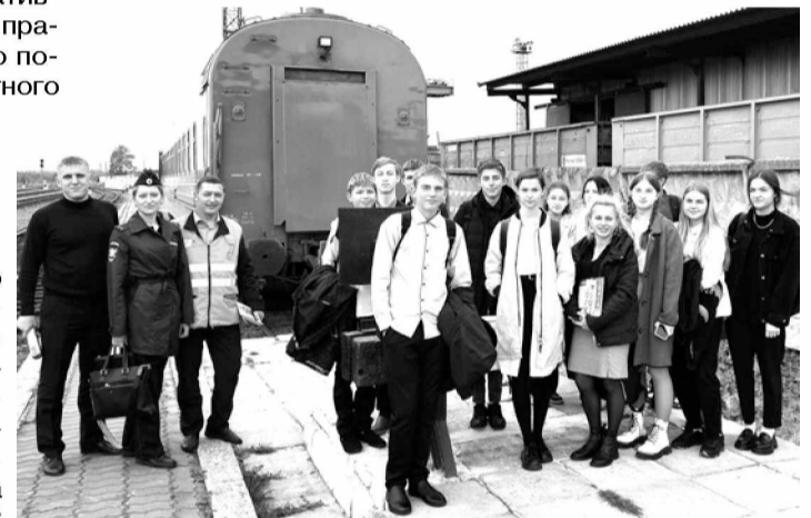
По материалам пресс-служб УТ МВД России по ДФО и Ванинского ЛО МВД России на транспорте.

Завершено расследование уголовного дела по обвинению ранее не судимого 49-летнего работника порта Ванино в хищении топлива из служебного автомобиля (имущество предприятия). Он совершил кражу бензина из топливного бака, сообщая диспетчеру недостоверные сведения о показаниях спидометра при оформлении путевых листов. В результате им было похищено 75,2 литра топлива на общую сумму 3602 рубля 78 копеек. В ходе расследования подозреваемый дал признательные показания, возместил ущерб. Уголовное дело направлено в суд.