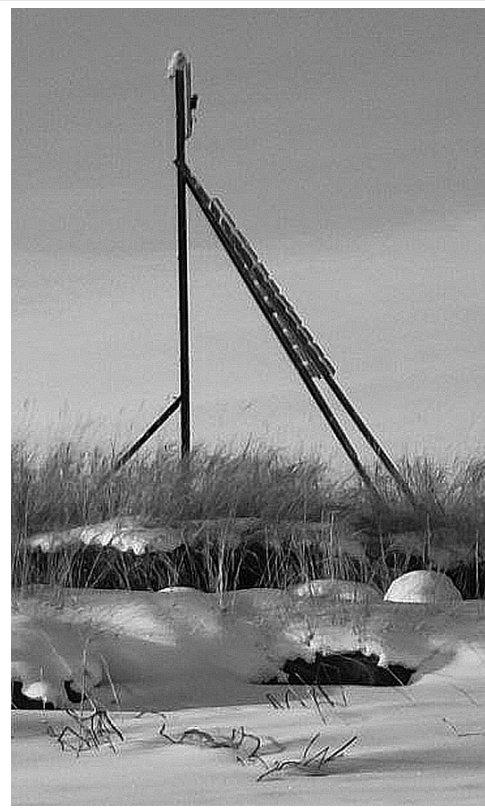
С уважением, Александра Степанова, специалист по связям с общественностью филиала Комсомольский ФГБУ "Заповедное Приамурье"

Птичье "население" Комсомольского заповедника представлено 284 видами. Украшением берегов реки Горин являются белоплечие и белохвостые орланы, а в глухой темнохвойной тайге можно встретить дикушу, японского и амурского свиристеля, рыжую овсянку.