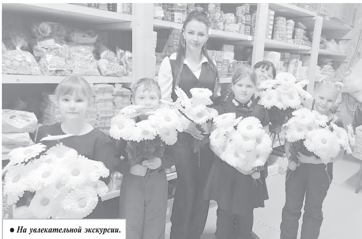
● На увлекательной экскурсии.