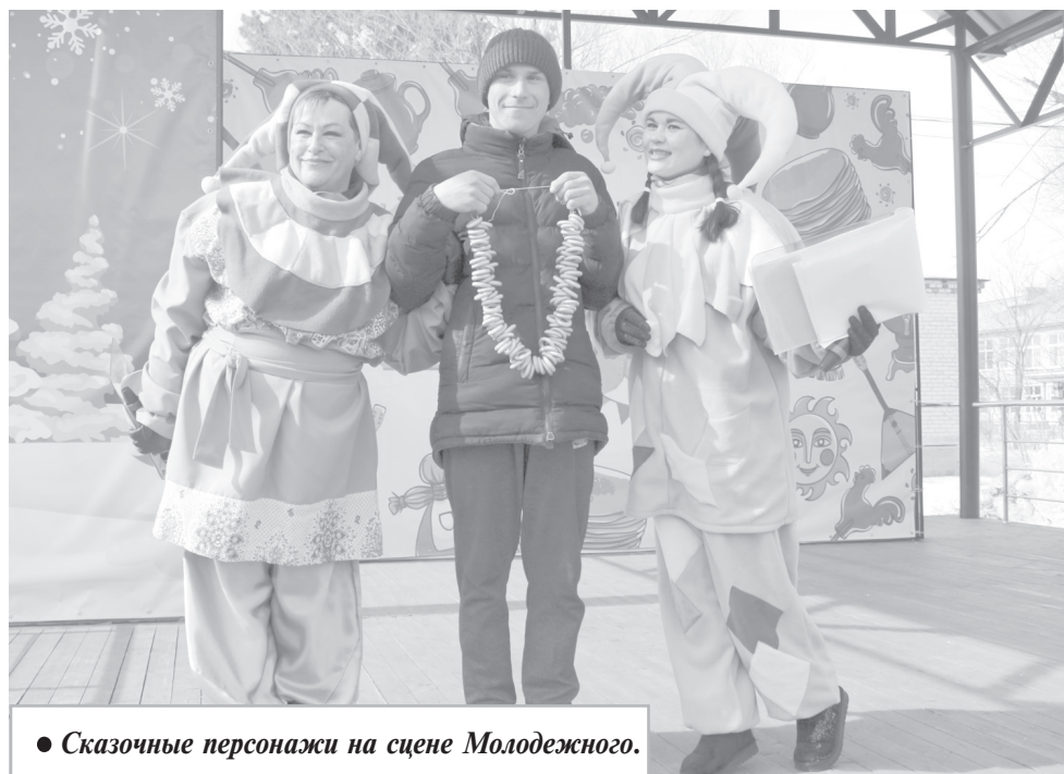
● Сказочные персонажи на сцене Молодежного.