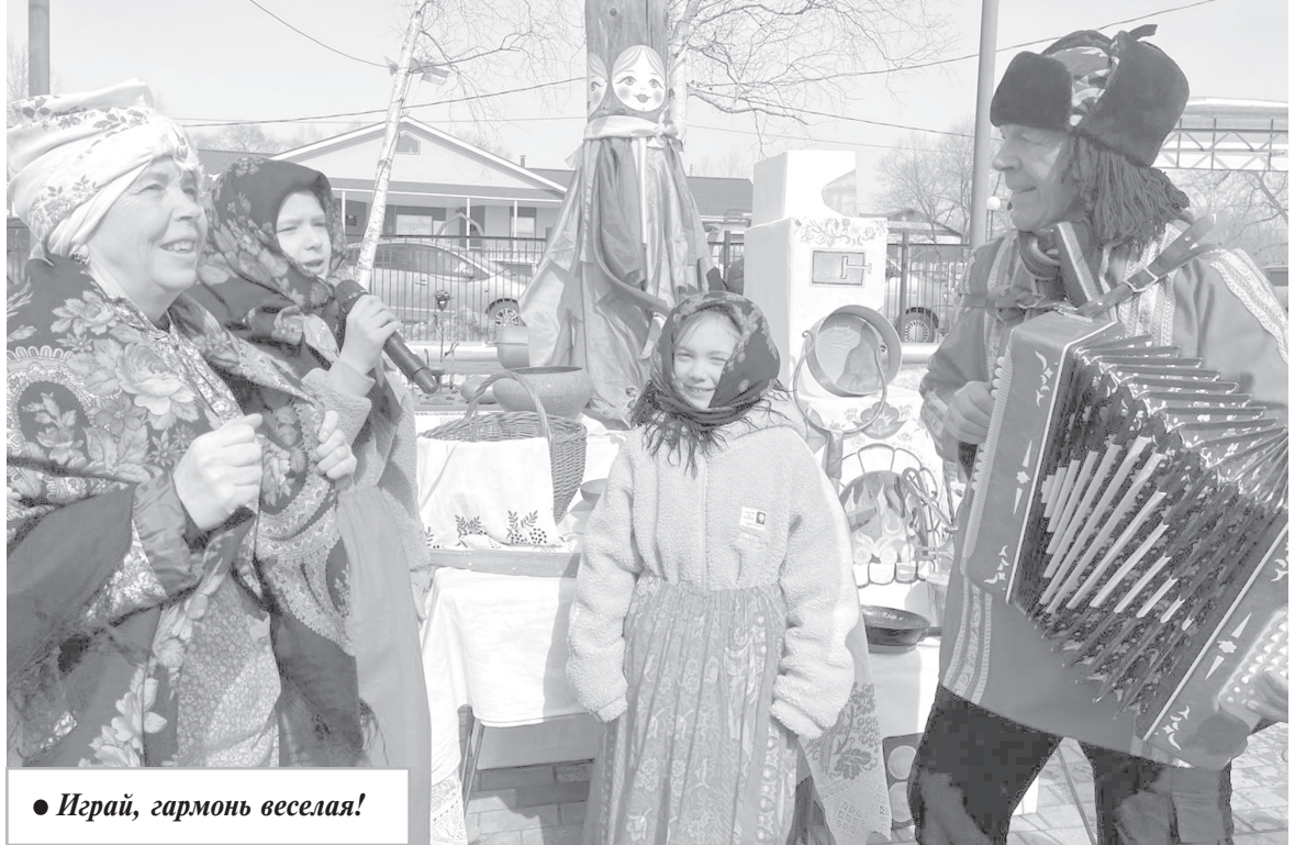
● Играй, гармонь веселая!

Веселый, яркий, звонкий конкурс «Душа-Масленица» не оставил равнодушных на площади. В конкурсе принимали участие шесть красавиц-Маслениц, представительниц разных трудовых коллективов. Девушки предстали