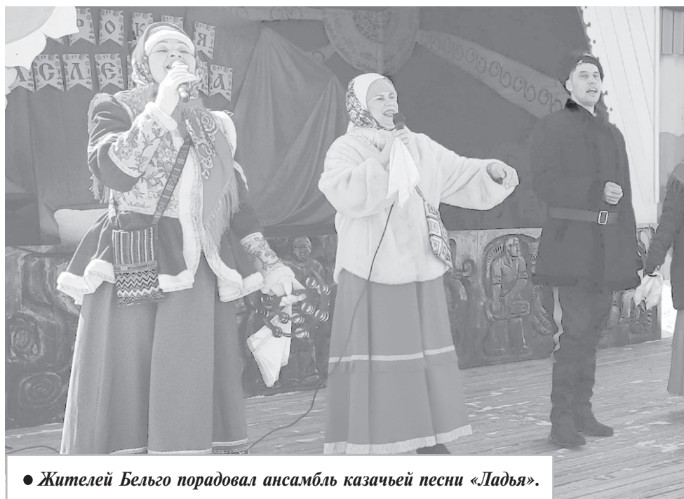
● Жителей Бельго порадовал ансамбль казачьей песни «Ладья».

От Дома культуры выступали хореографический кружок «Экспрессия» и вокальная группа «Сударушка». Гостей из Комсомольска-на-Амуре представили ансамбль народной песни «Славница», Центр внешкольной работы «Юность», шоу-группа «Бусы» и ансамбль народной песни «Любавушка».