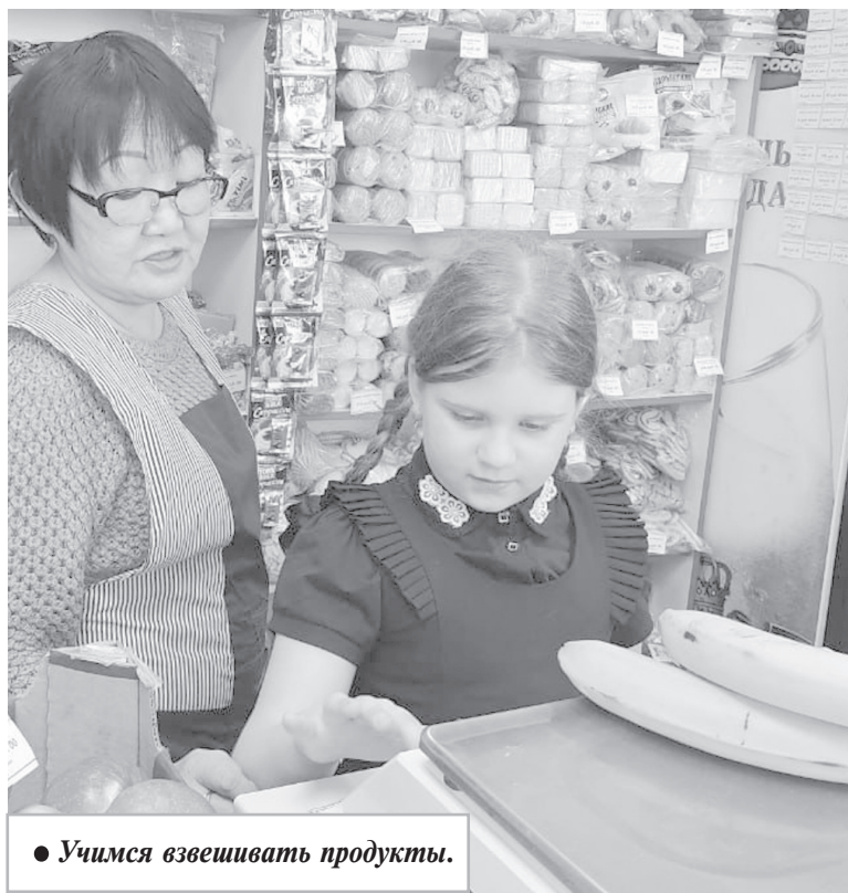
● Учимся взвешивать продукты.