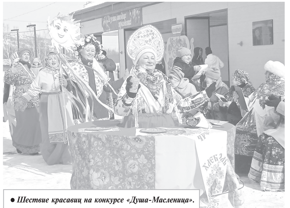
● Шествие красавиц на конкурсе «Душа-Масленица».