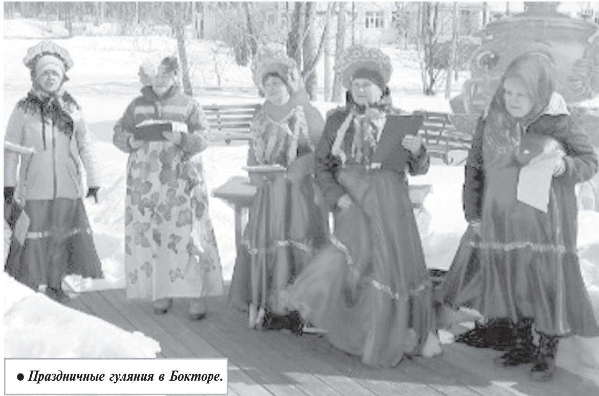
● Праздничные гуляния в Бокторе.

Масленица — весенний праздник веселья и угощений. Традиционные проводы зимы берут свое начало еще с языческих времен. Уже тогда славянские народы праздновали его с особым размахом. В этом году масленичная неделя продлилась с 11 по 17 марта. Это время водить хороводы, печь блины и веселиться. Основные гуляния пришлось на 17 марта, а в этот день еще и Прощеное воскресенье. На него принято просить прощение за все обиды, что накопились за прошедший год.