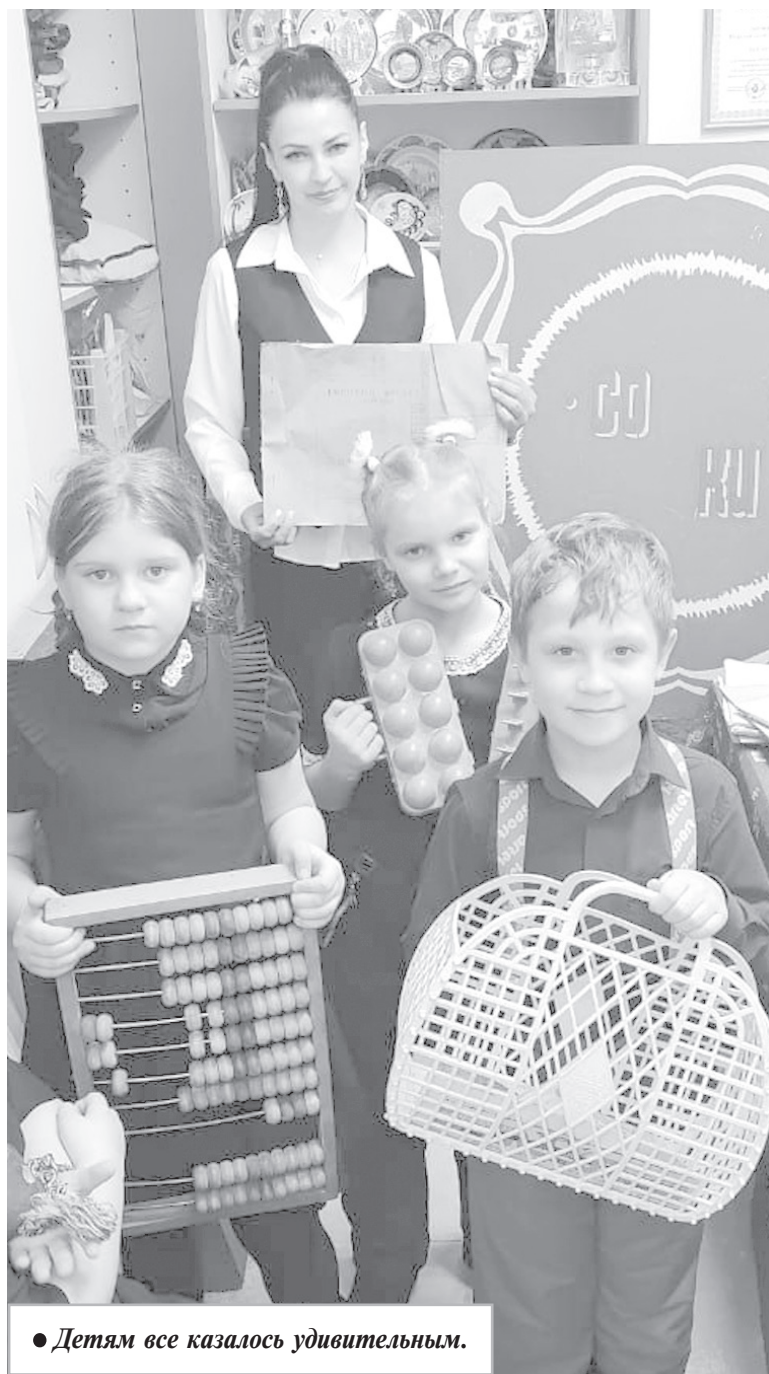
● Детям все казалось удивительным.