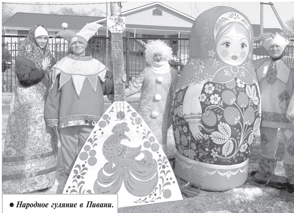
● Народное гуляние в Пивани.