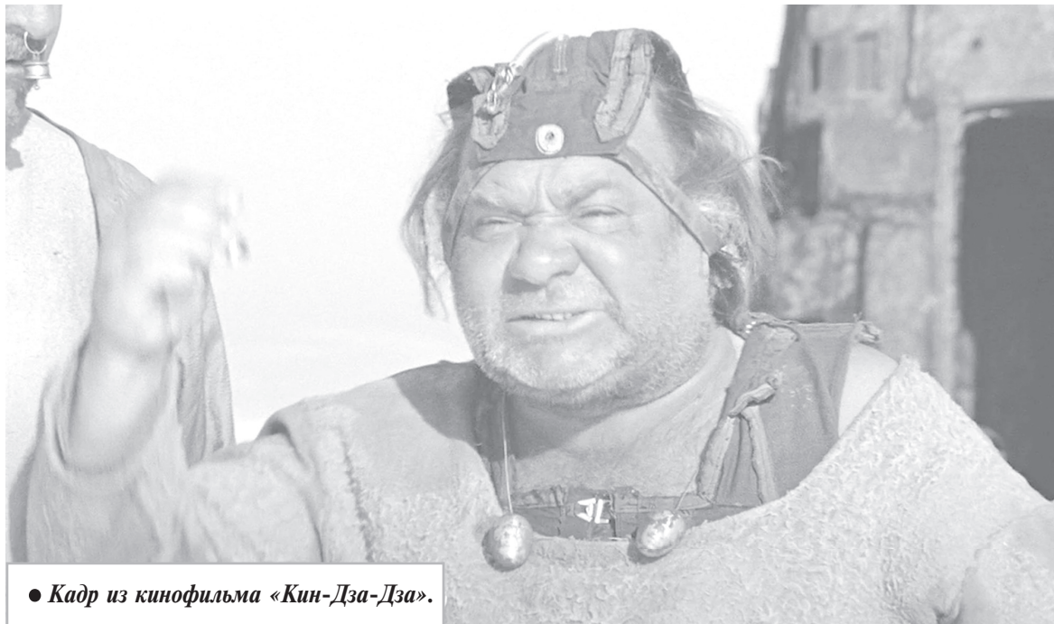
● Кадр из кинофильма «Кин-Дза-Дза».

Проститься с любимым актером пришли многие. Вся улица Чехова от Садового кольца до «Ленкома» представляла собой один людской поток. Он был нескончаем — зрители пришли проститься с мастером. В день его смерти, когда на двери театра повесили объявление о том, что Евгений Леонов умер и спектакль не состоится, ни один зритель не сдал билет. В ближайшей церкви купили свечей, встали у входа и несколько часов мысленно прощались с актером. Поминальная молитва состоялась в этот раз не на сцене, а в жизни.