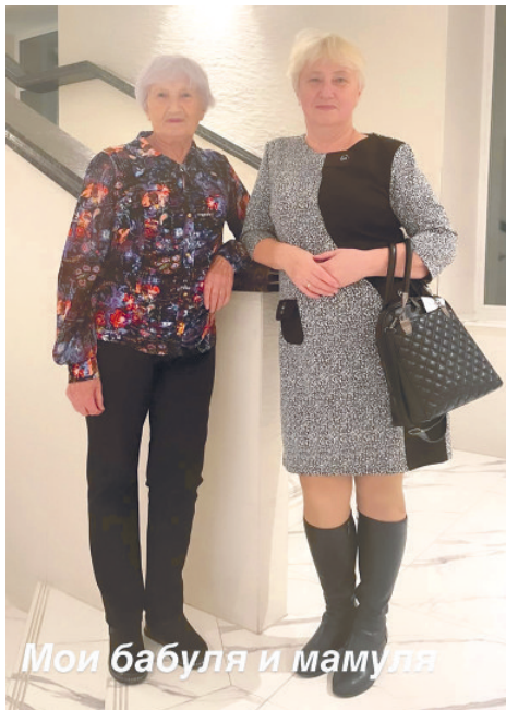
Мои бабуля и мамуля

Моя мама и бабушка самые лучшие и я их очень люблю.