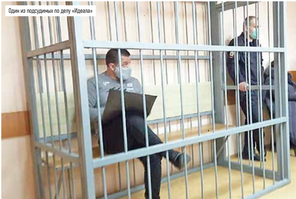
Один из подсудимых по делу «Идеала»