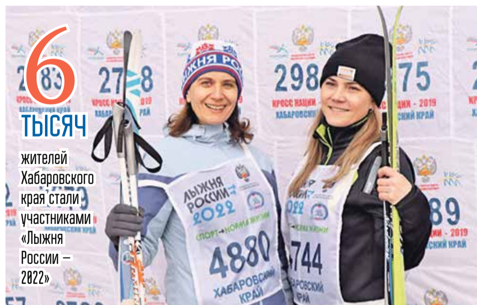
ФОТО: МИНСПОРТА ХАБАРОВСКОГО КРАЯ