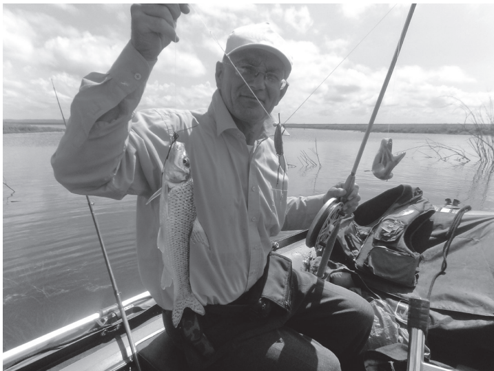
Конь и козатка — начало ухи

Автор: Александр СМЕРНОВ. Фото из личного архива автора