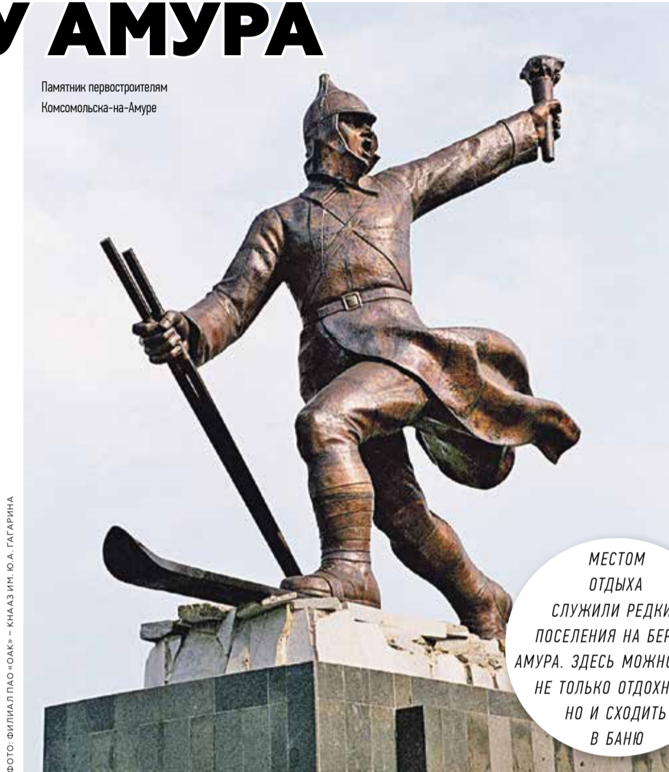
Памятник первостроителям Комсомольска-на-Амуре

Утром 26 декабря 1933 года после короткого митинга бойцы, с песнями пройдя по улицам Хабаровска, отправились в путь. Повалил густой снег, и бойцы, одетые в новые полушубки, шлемы с вязаными подшлемниками и в валенки, в полной боевой выкладке – с оружием, запасом патронов и с вещмешками, в которых помимо небольшого запаса питания были постельные принадлежности, летнее обмундирование и обувь, устремились на север сквозь ледяные торосы Амура. Общий вес ноши одного человека составлял 30 килограммов. Остальное имущество