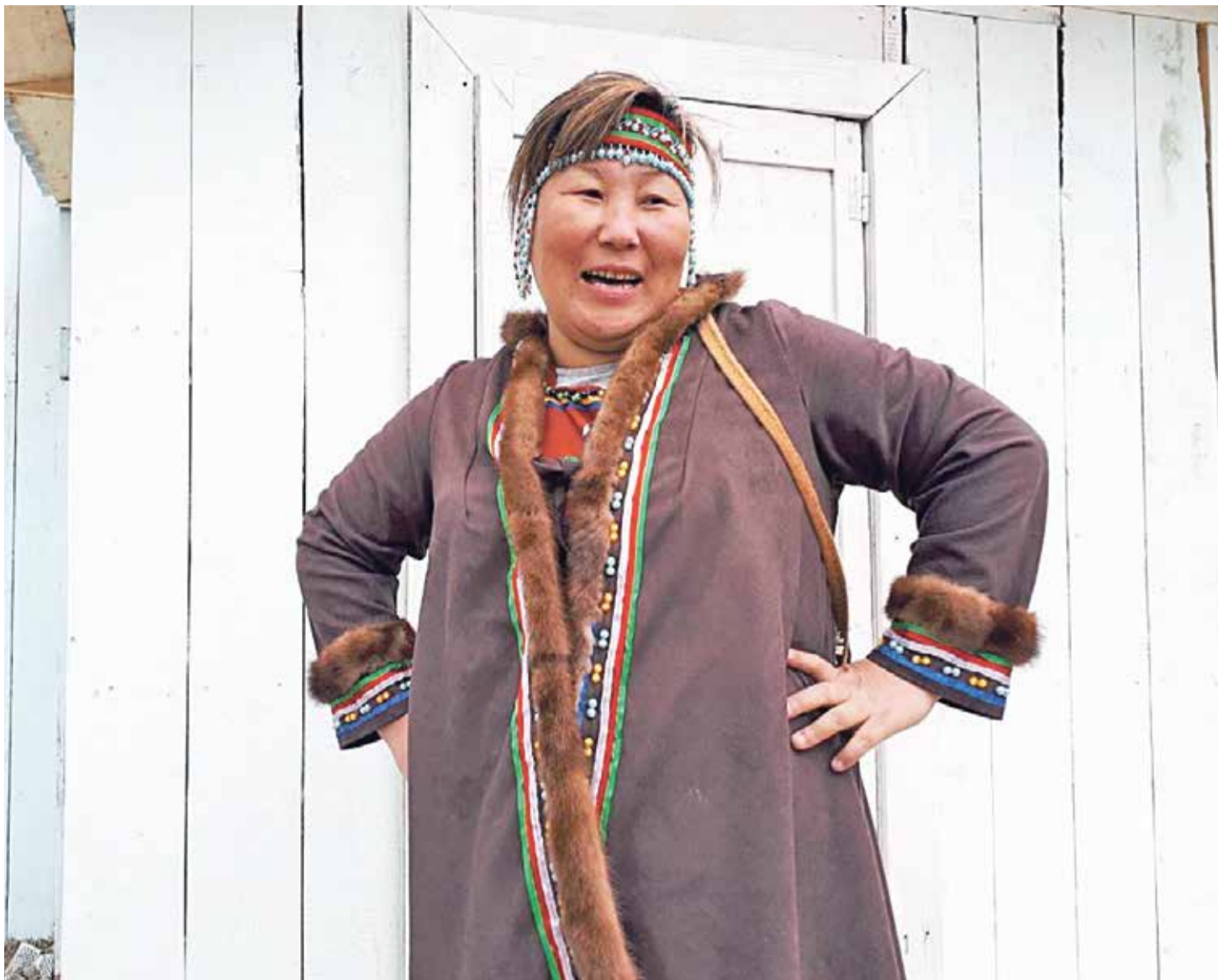
В селе Удское остались потомки манегров

Хабаровский край один из самых богатых в этнографическом плане регионов России. Шутка ли, только коренных народов у нас насчитывается восемь! И у каждого своя история, свои древние традиции. А ведь полтора столетия назад в описаниях этнографов значилось ещё больше этносов: дауры, манегры, дючеры и так далее. Какова их судьба, давайте разберёмся.