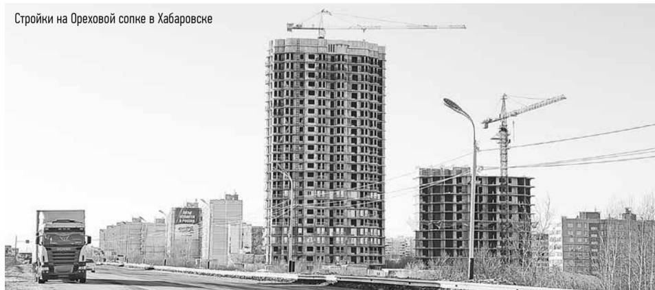
Стройки на Ореховой сопке в Хабаровске

При этом ёмкость рынка лифтового оборудования в Хабаровском крае весьма значительная. Только в прошлом году, по информации регионального министерства ЖКХ, в домах по программе капитального ремонта заменили свыше двух сотен подъёмников на сумму больше 600 млн рублей. А ведь есть ещё новостройки!