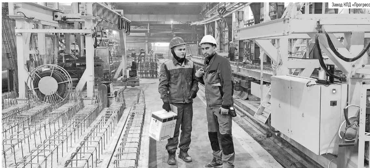
Завод КПД «Прогресс»