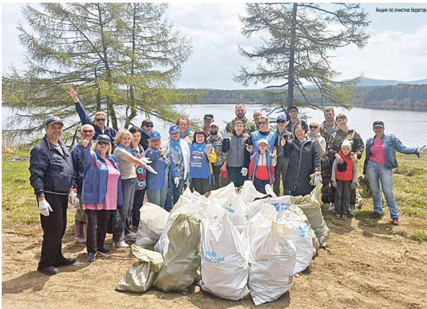
Акция по очистке берегов

В 2023 году Хабаровский край поднялся на две строки в общероссийском рейтинге регионов и вернулся в топ-30 списка самых успешных территорий России. Эксперты отмечают, что на улучшение позиции — в том числе — повлияли шаги местных властей в части реализации национальных проектов, инициированных Президентом России Владимиром Владимировичем Путиным.