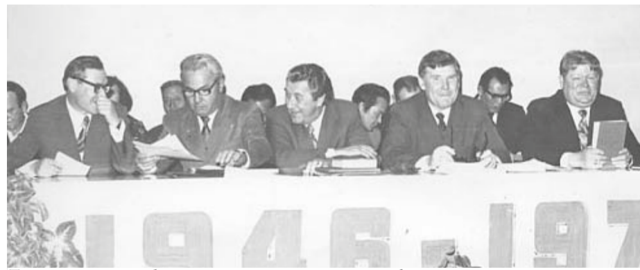
Торжественное собрание, посвященное 30-летию филиала советского иновещания на Дальнем Востоке. Хабаровск, 1976 г.

В конце декабря 1947 года заведующий отделом управления пропаганды и агитации ЦК ВКП(б) Д.Т. Шепилов получил секретную записку следующего содержания: «Начальник политического управления войск Дальнего Востока генерал-лейтенант тов. Зыков докладывает, что в декабре сего года радиостанция «Голос Соединенных Штатов» начала вести передачи на русском языке, специально рассчитанные на население советского Дальнего Востока. Передачи ведутся ежедневно с 21:00 до 23:00 по хабаровскому времени на ко-