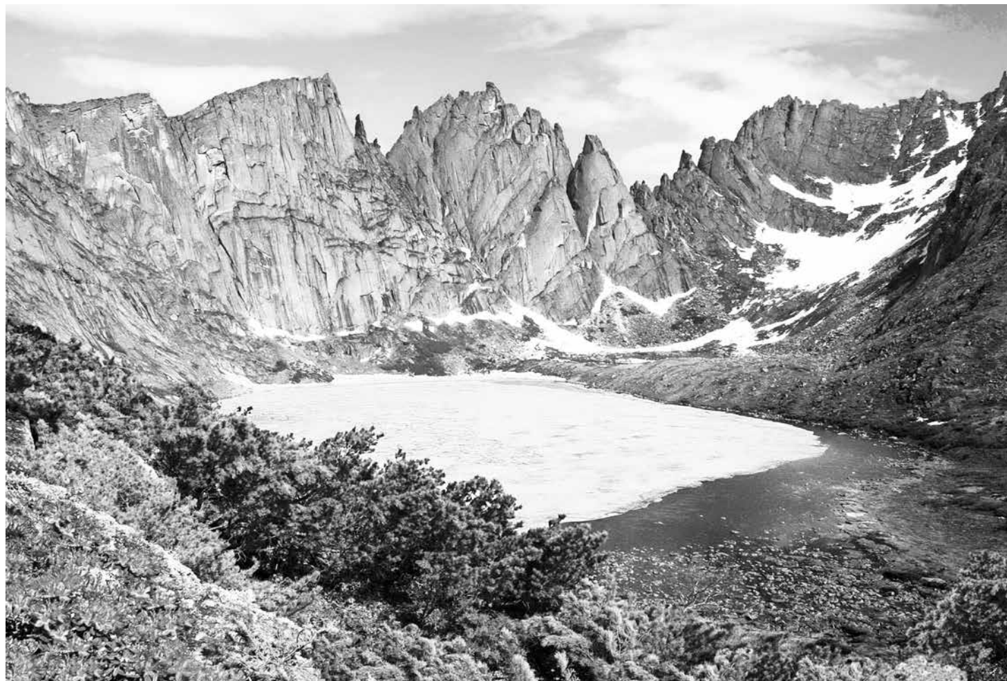
Горное озеро в Хабаровском крае

В Хабаровском крае подвели итоги реализации проектов социально ориентированных некоммерческих организаций (СОНКО) в прошлом, 2023 году. Благодаря финансовой поддержке регионального правительства удалось запустить больше полусотни инициатив. Все они направлены на то, чтобы сделать жизнь людей в нашем крае лучше, удобнее и интереснее. Предлагаем познакомиться с некоторыми из них.