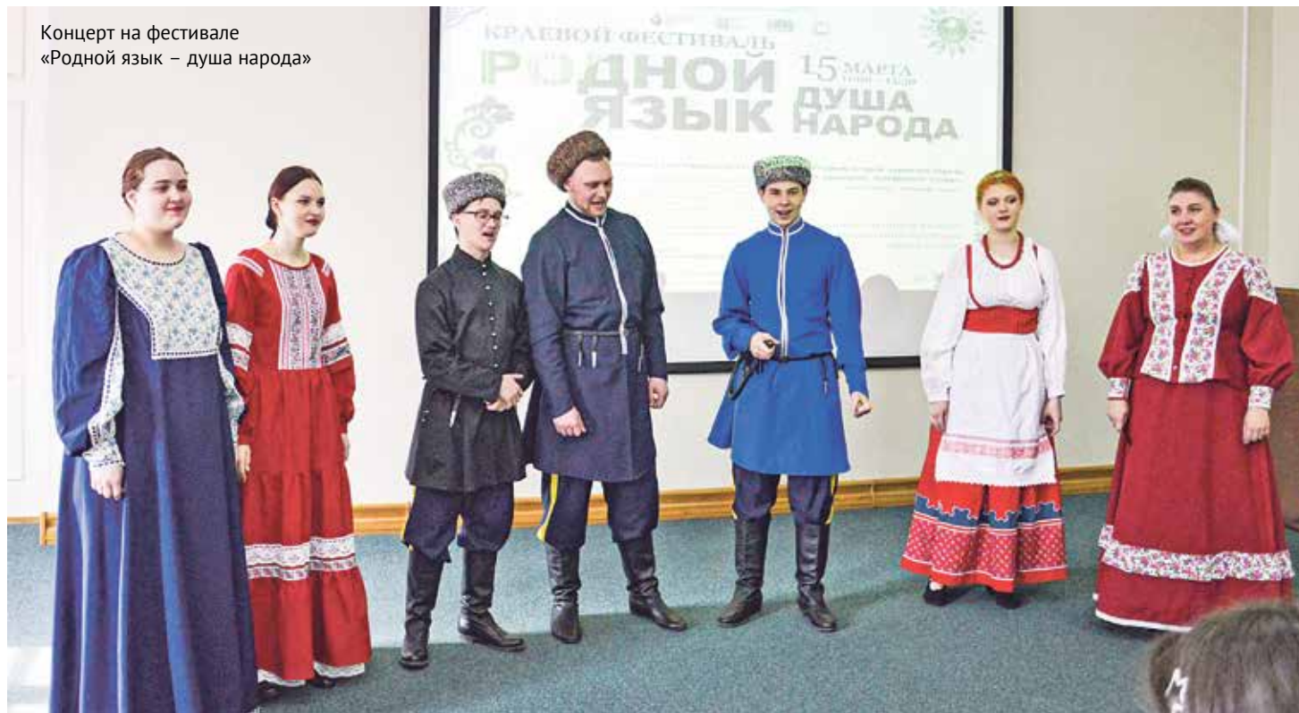
Концерт на фестивале «Родной язык – душа народа»

В нашем многонациональном Хабаровском крае проживают представители 131 национальности и 8 коренных малочисленных народов Севера – каждый этнос уникален своей культурой, которую необходимо сохранить. Но кроме этого, не менее важно научиться жить в мире и дружбе, чем всегда отличалась наша страна. Именно с этой целью у нас в регионе с 2013 года проходит фестиваль «Родной язык – душа народа», главными гостями которого является молодёжь Хабаровского края. Площадкой для фестиваля традиционно становится Дальневосточная государственная научная библиотека.