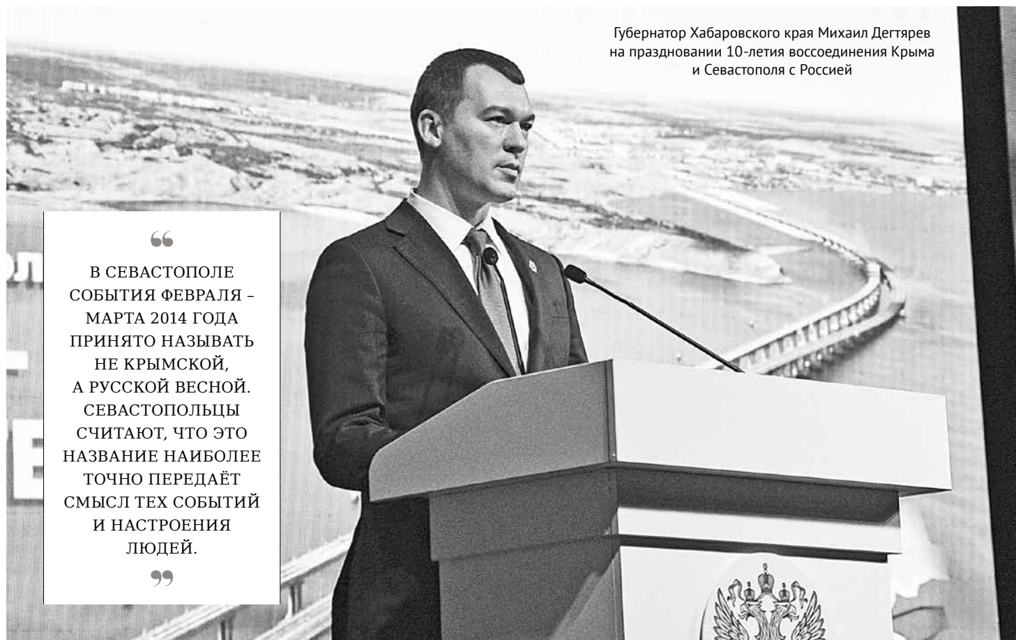
Губернатор Хабаровского края Михаил Дегтярев на праздновании 10-летия воссоединения Крыма и Севастополя с Россией

Ровно 10 лет назад, в марте 2014, произошло событие, которое навсегда изменило ход мировой истории. Оно заложило начало новой эпохи, когда Россия громко заявила, что всеми своими силами готова защищать русских людей от любой несправедливости. Речь идёт о возвращении полуострова Крым в состав нашей страны. Каждый год по всей стране 18 марта вспоминают те события. Отметим годовщину и в Хабаровске.