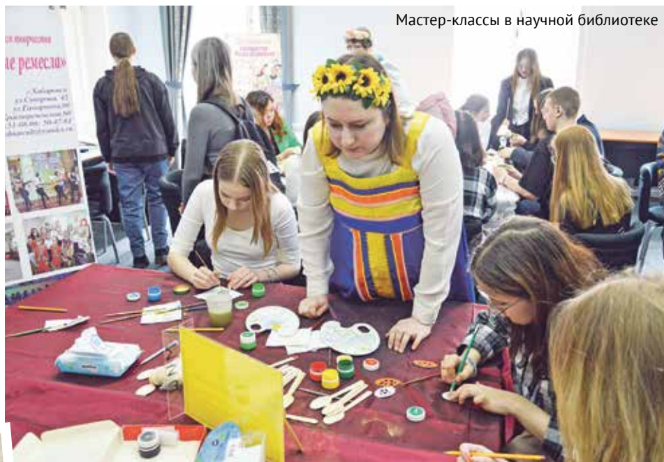
Мастер-классы в научной библиотеке

буквами, при этом часто стал использоваться курсив. В религиозных текстах искусно раскрашенные буквы приобретали вид растений, животных, ангелов, добавлялись сложные узоры.