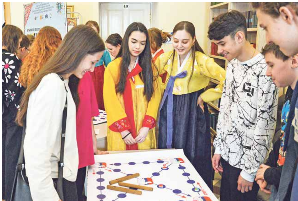
Мастер-классы проводились по письму на русском, армянском и корейском языках – корпели с перьями и кистями на всех этажах библиотеки.