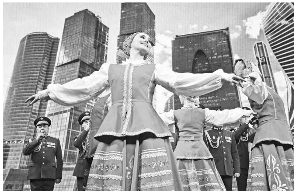
Празднование 10-летия воссоединения Крыма и Севастополя с Россией

Итак, 18 марта 2014 года историческое событие состоялось. В этот день Президент Российской Федерации Владимир Путин, председатель Совета министров Крыма Сергей Аксенов, председатель Государственного совета Крыма Владимир Константинов и глава Севастополя Алексей Чалый подписали договор между Российской Федерацией и Республикой Крым о принятии в состав страны Республики Крым и образования в составе Российской Федерации новых субъектов. Это стало настоящим праздником для всех.