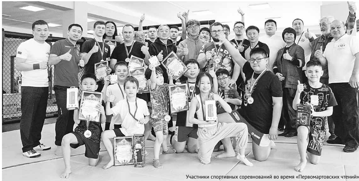
Участники спортивных соревнований во время «Первомартовских чтений»

В Хабаровске в марте отметили годовщину начала движения за независимость Кореи. Его называют Первомартовским, так как в этот день в 1919 году в оккупированной Японией Корее местные патриоты огласили декларацию независимости страны, положив начало целой серии мирных демонстраций. В краевой столице 105-летие этих событий отметили научной конференцией и соревнованиями по корейской борьбе сирым.