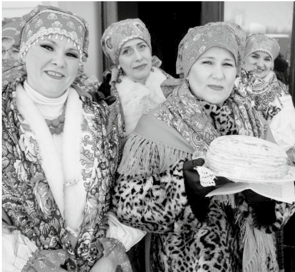
В рамках празднования Масленицы комсомольчан угостят блинами

Участниками краевой смены стали 130 школьников и студентов колледжей и техникумов. Они прошли масштабный отбор — поступило более 250 заявок. В течение смены ребята смогут ближе познакомиться с направлениями, миссией и ключевыми проектами РДДМ, а опытные наставники помогут им стать настоящими примерами и истинными лидерами для сверстников. По итогам смены каждый участник получит индивидуальный план развития своих компетенций.