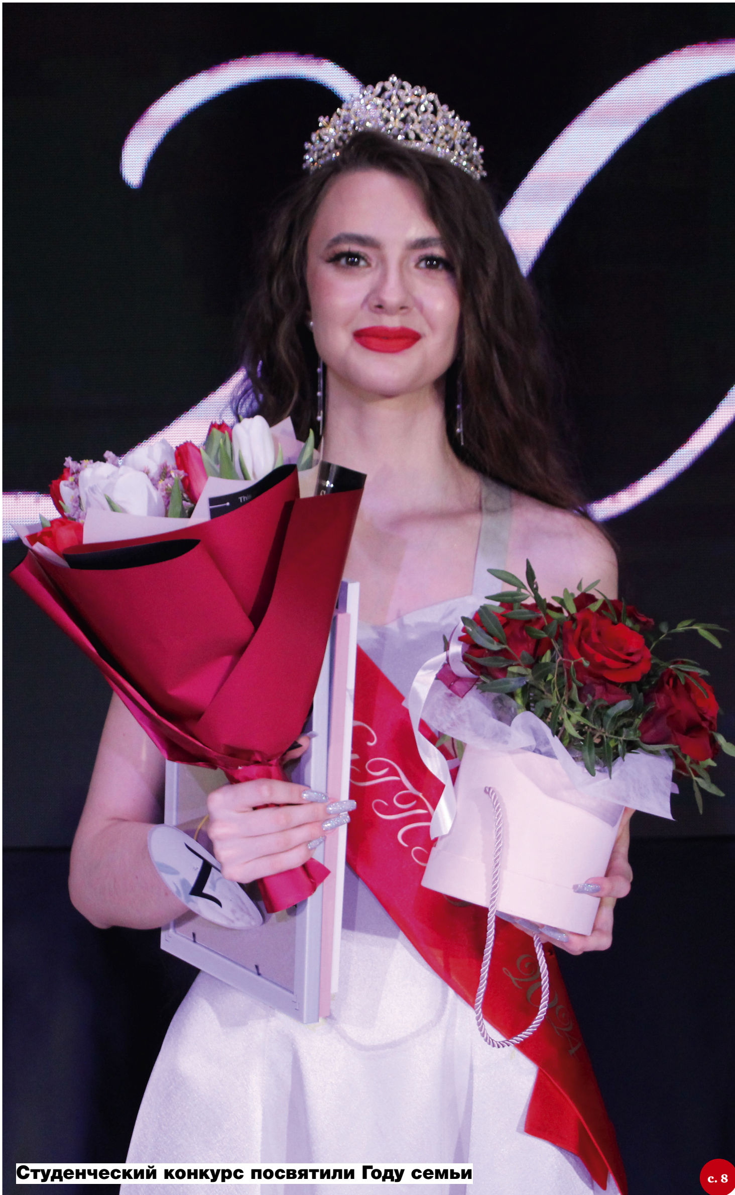
Студенческий конкурс посвятили Году семьи