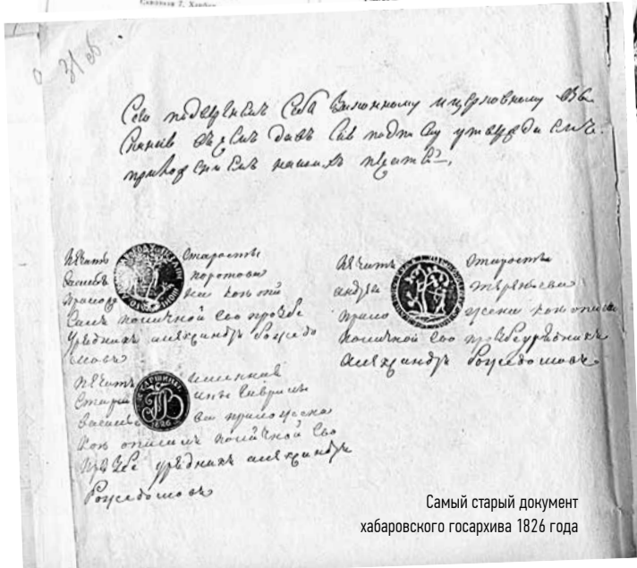
Самый старый документ хабаровского госархива 1826 года