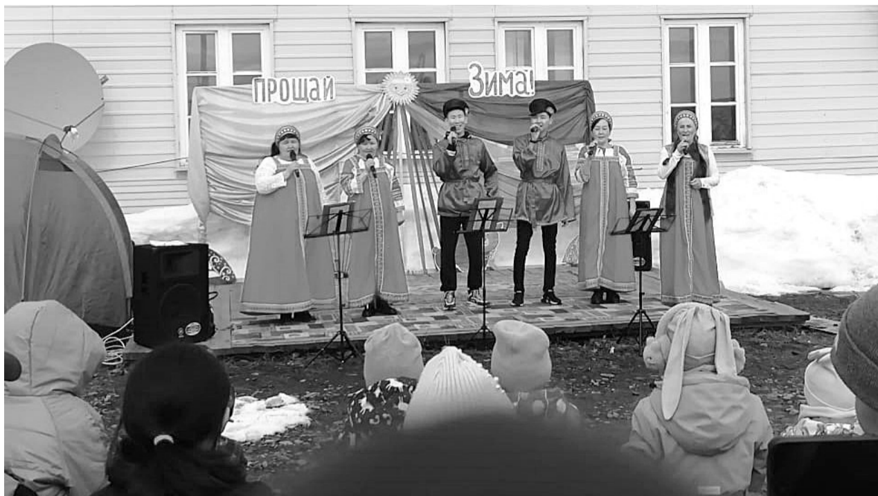
В Нелькане условная точка в смене времен года поставлена! Сельчане распрощались с Зимой и встретили Весну-красну задорными танцами с этническим колоритом танцевальной группы «Алетейя» и русскими народными песнями в исполнении хоровой группы Дома культуры.

Главными героями праздника стали представленные на конкурс чучела Зимы: нельканцам предложили принять участие в конкурсе по их изготовлению «Многоликая зима», а вот какими они получились, сейчас узнаем.