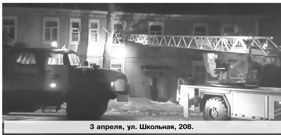
3 апреля, ул. Школьная, 208.

вале многоквартирного дома № 9-б по ул. Орлова, предположительно вследствие короткого замыкания в электропроводке, горели кладовые. Из 1-го и 2-го подъездов пожарными эвакуированы 20 жильцов в безопасное место, во избежание отравления продуктами горения.