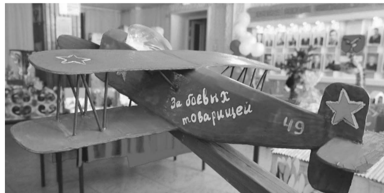
По информации администрации Николаевского района.

139 работ представлено на конкурс. 11 из них – коллективные.