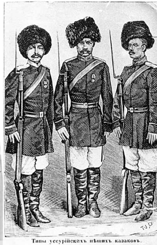
Типы уссурийских пших казаков.