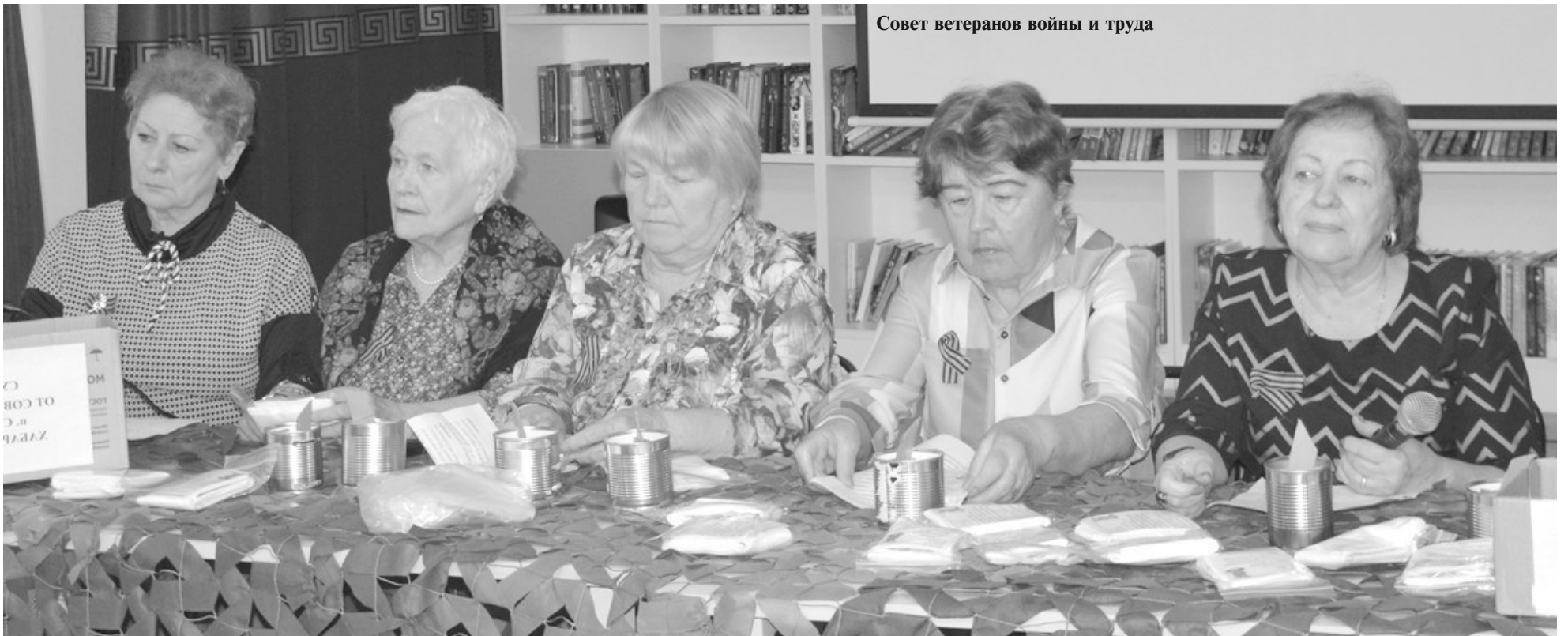
Совет ветеранов войны и труда