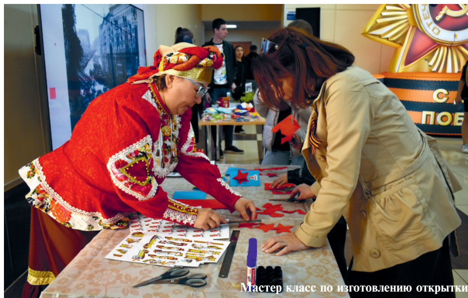
Мастер класс по изготовлению открытки