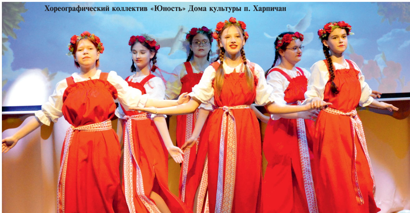
Хореографический коллектив «Юность» Дома культуры п. Харпичан