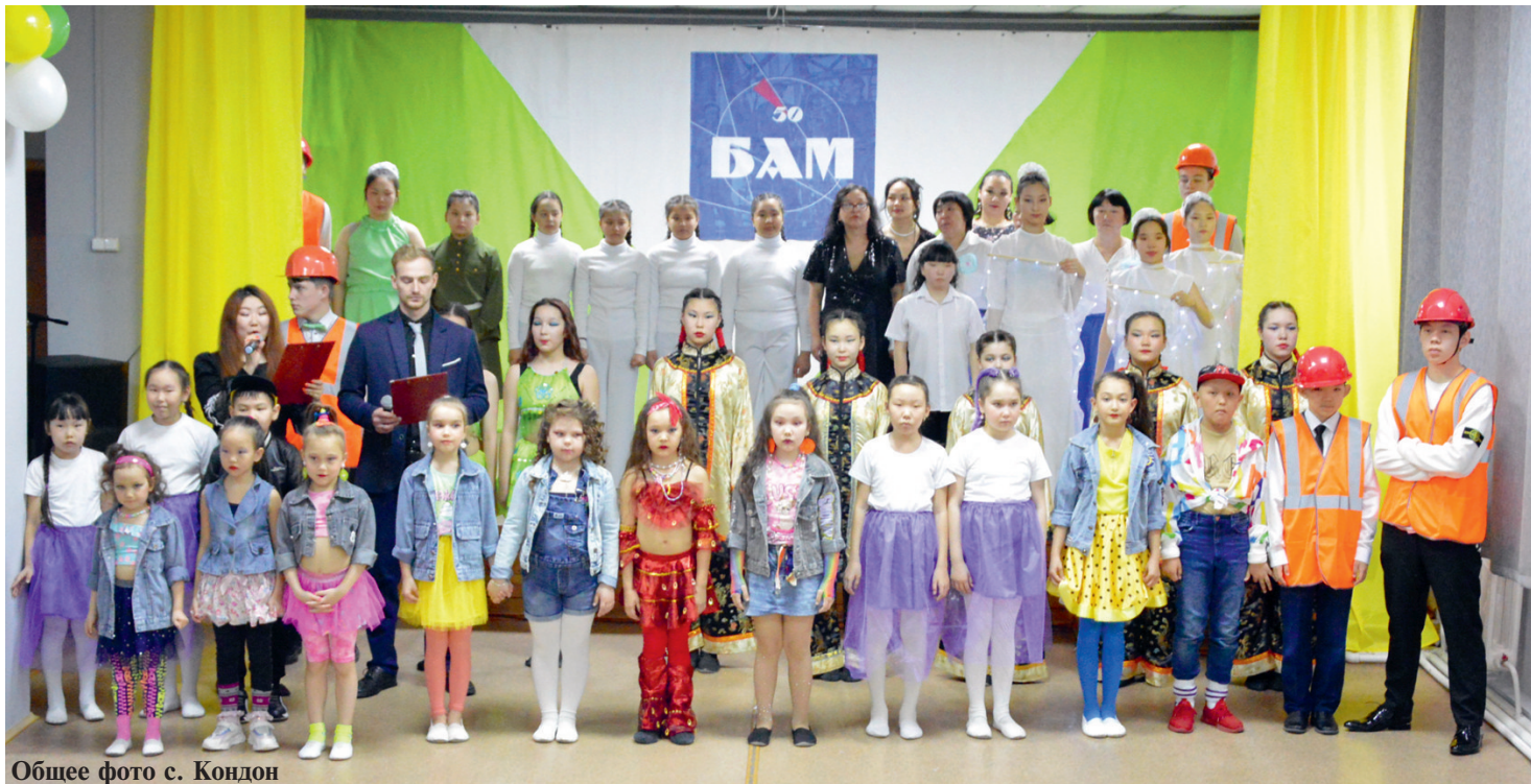
Общее фото с. Кондон

УЧРЕДИТЕЛЬ: Администрация Солнечного муниципального района Хабаровского края и Комитет по информационной политике и массовым коммуникациям Правительства Хабаровского края.