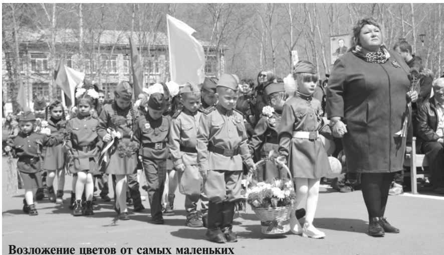
Возложение цветов от самых маленьких