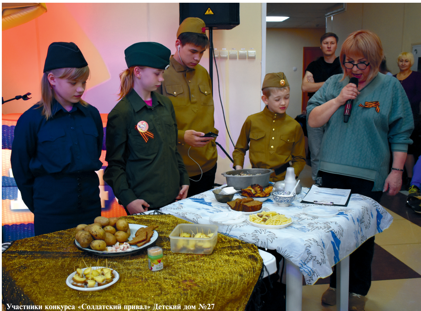
Участники конкурса «Солдатский привал» Детский дом №27