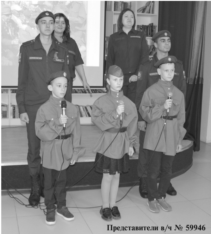
Представители в/ч № 59946