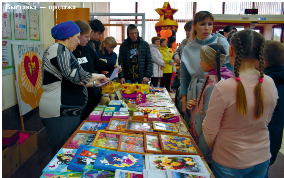
Выставка — продажа