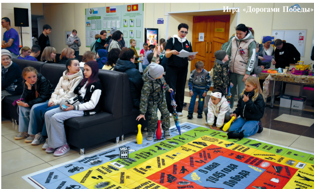
Игра «Дорогами Победы»

Открыл серию мероприятий «Парк Победы!», в котором расположились разнообразные интерактивные площадки, полевая кухня, фотозоны, ярмарки, спортивные активности, мастер — классы, викторины и