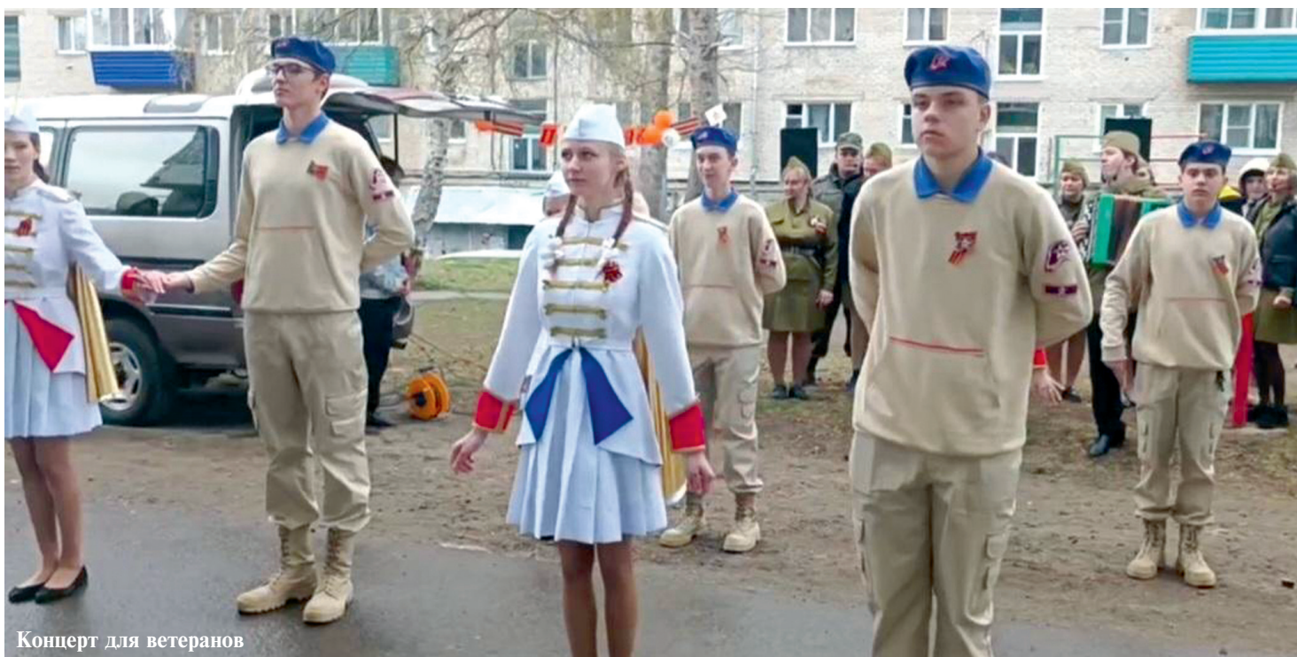
Концерт для ветеранов

Поблагодарить ветеранов за мирное небо над головой и проявить уважение смогли активисты музея Центра творчества детей и молодёжи. Они поздравили ветеранов на дому и в больнице. Их встреча была наполнена необыкновенной радостью и теплом.