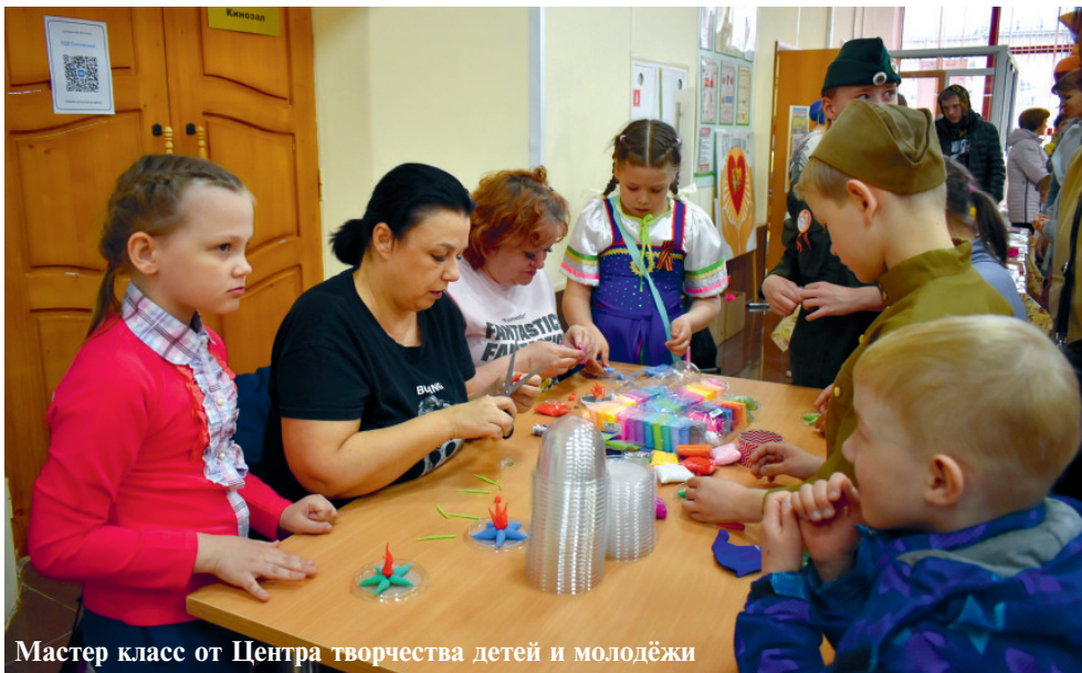
Мастер класс от Центра творчества детей и молодёжи