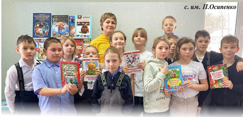
с. им. П.Осипенко

Акции «Письмо солдату», и «Дарите книгу с любовью» прошли в библиотеках района имени Полины Осипенко.