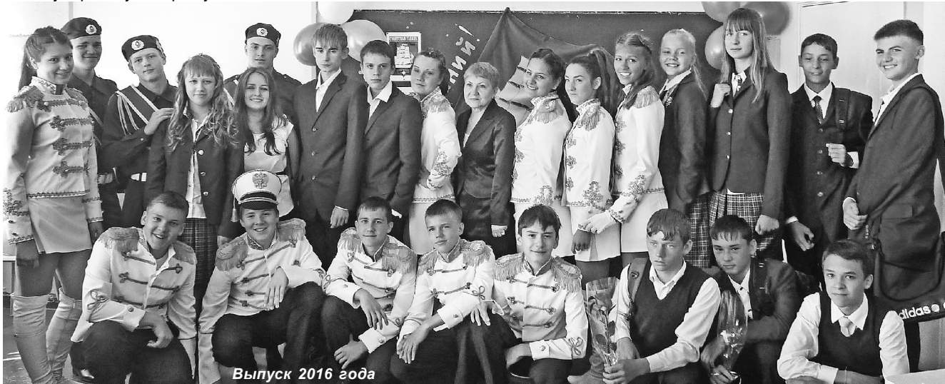
Выпуск 2016 года

ный человек. Вместе со своими учениками она посещает выставки, театры, ходит в походы, вместе смотрят фильмы, неоднократно она выезжала вместе с ребятами в город Владивосток на экскурсии по учебным заведениям.