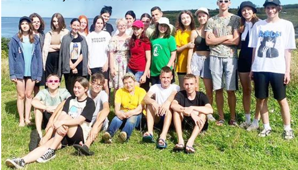
2023 год. Поход на Ситуан с десятиклассниками