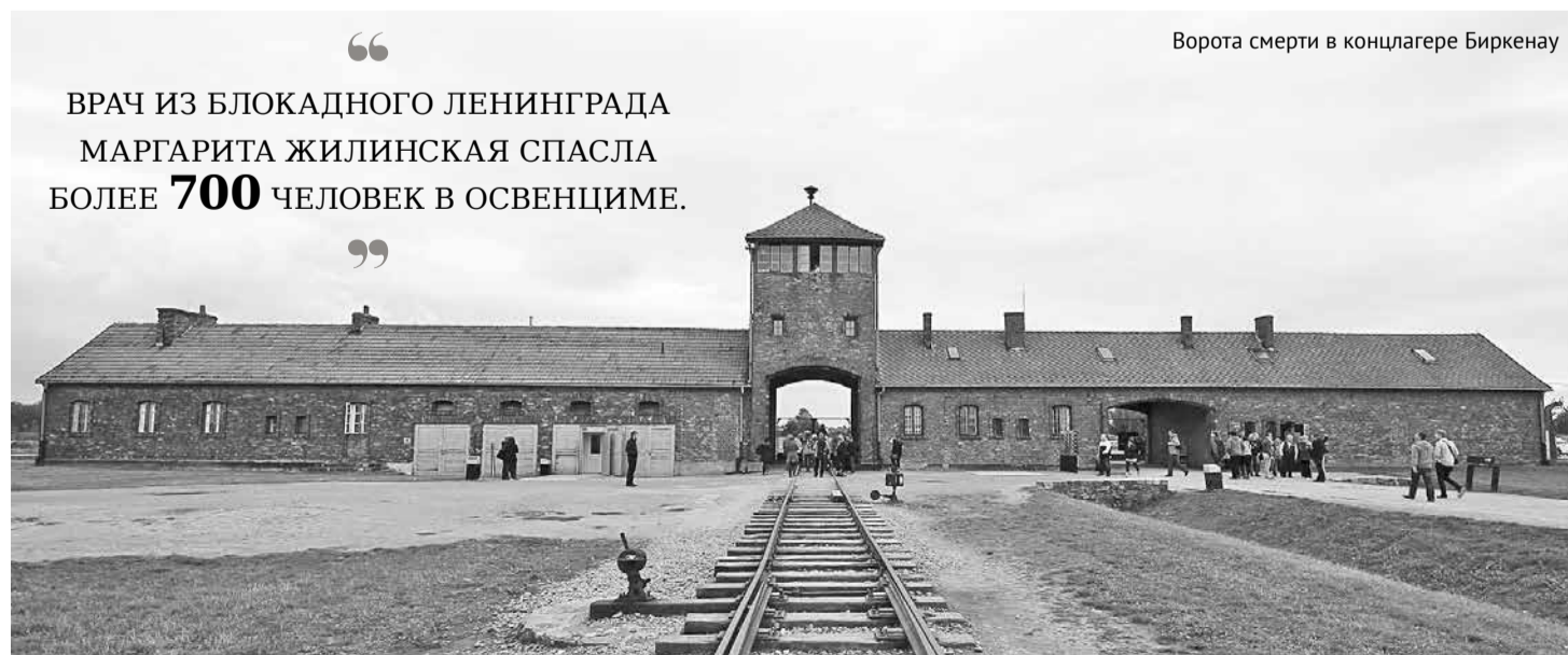
Ворота смерти в концлагере Биркенау

“ ВРАЧ ИЗ БЛОКАДНОГО ЛЕНИНГРАДА МАРГАРИТА ЖИЛИНСКАЯ СПАСЛА БОЛЕЕ 700 ЧЕЛОВЕК В ОСВЕНЦИМЕ. ”