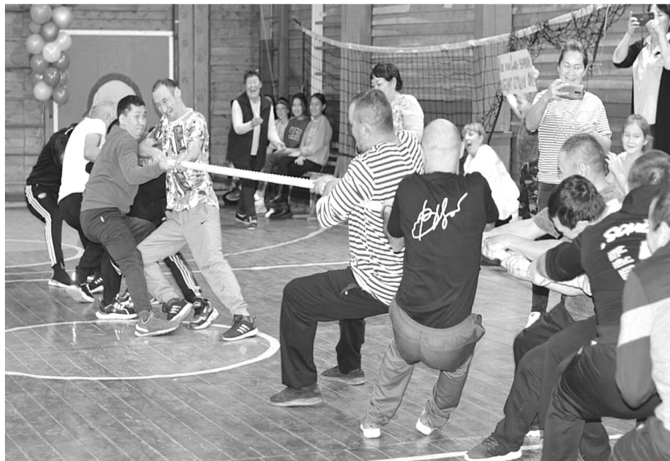
В третье воскресенье октября в России отмечают День отца. Праздник относительно молодой, но отметили его во всем районе.

В СДК села Аим для участников проводились различные конкурсы, спортивные игры, предлагали ответить на вопросы викторины. А в фойе была организована выставка рисунков и поделок для пап.