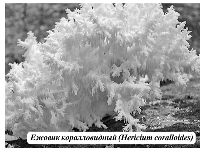
Ежовик коралловидный ( Hericium coralloides )

Трутовик зонтичный находят в европейской части России. Он растет на древесине, в том числе на корнях деревьев. Русский черный трюфель растет в Краснодарском крае, на Кавказе и в европейской части России. Этот гриб распространяют грызуны, олени, кабаны и насекомые, которые едят плодовые тела.