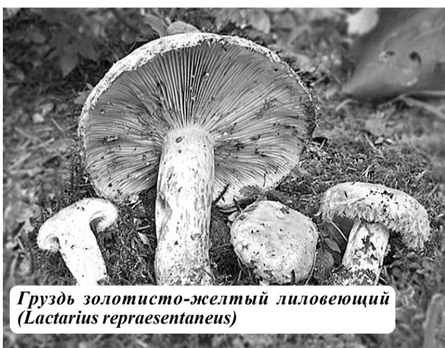
Груздь золотисто-желтый лиловеющий ( Lactarius repraesentaneus )

С 12 октября в силу вступила новая статья Уголовного кодекса России. Теперь за уничтожение или повреждение грибов и растений, которые включены в Красную книгу, грозит наказание до девяти лет лишения свободы (однако, чтоб получить девять лет и максимальный штраф, нужно собрать лесную банду и всей этой бандой охотиться за краснокнижными грибами с целью продажи крупными партиями. Ну а если человек собрал гриб случайно, то тут уже как карта ляжет. Можно отделаться и административкой, а можно и чем-то более серьезным. Юристы пока сами не очень понимают. – ред.). Президент Владимир Путин еще в апреле подписал эти изменения в УК РФ. О том, какие грибы нельзя собирать и что за это будет, читайте в материале «Газеты.Ru».