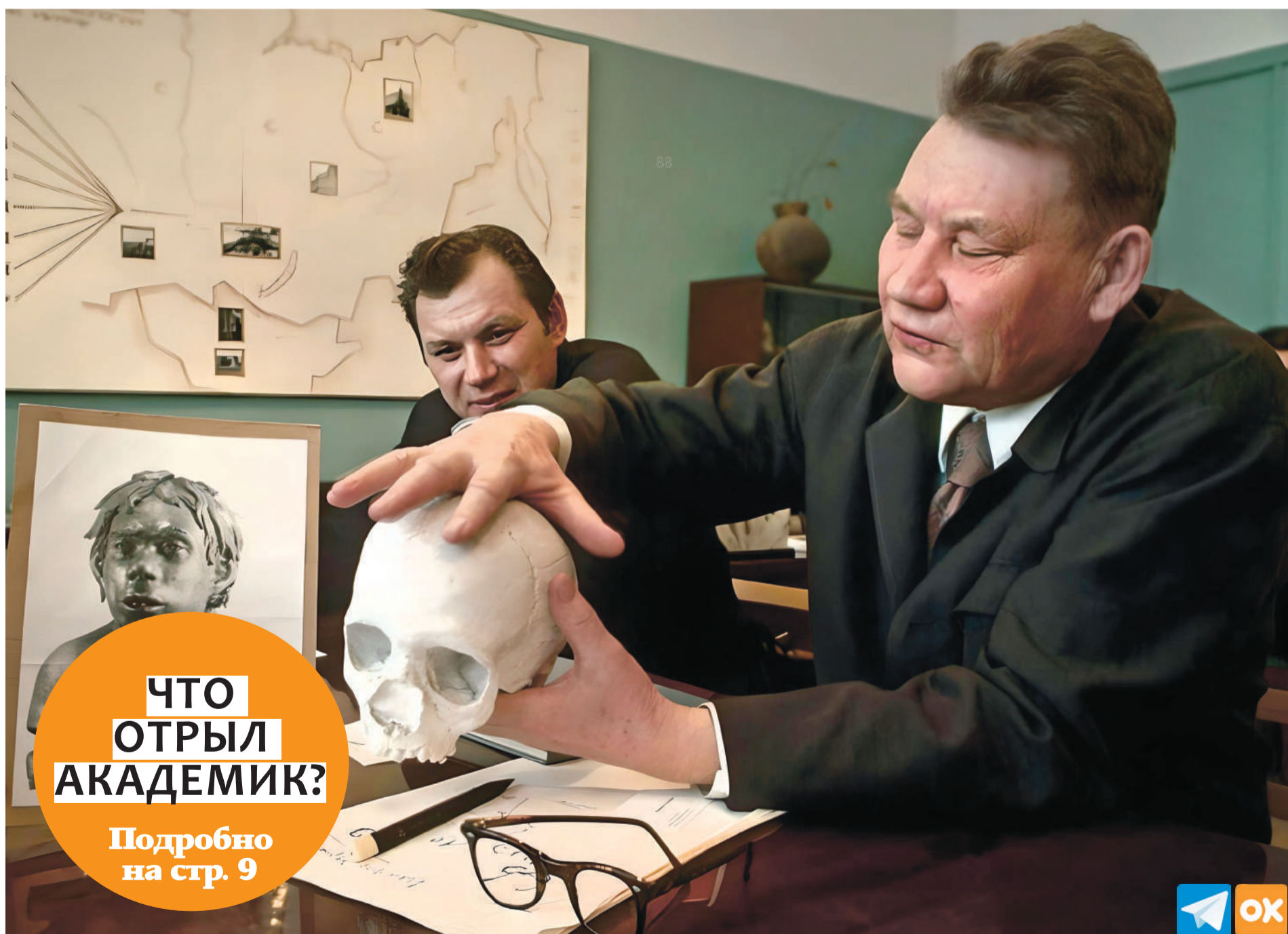
АКАДЕМИК АЛЕКСЕЙ ОКЛАДНИКОВ ДЕРЖИТ СЛЕПОК ЧЕРЕПА ЧЕЛОВЕКА, КОТОРЫЙ ЖИЛ 40 ТЫС. ЛЕТ НАЗАД. 1966 ГОД.