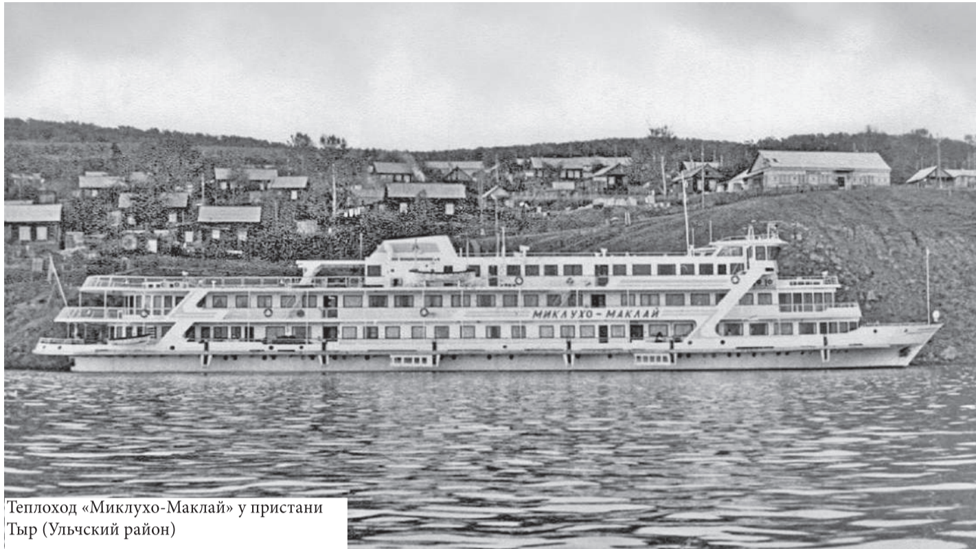
Теплоход «Миклухо-Маклай» у пристани Тыр (Ульчский район)

С нами пятую навигацию. Особенно нравятся ребятам щи и рассольники.