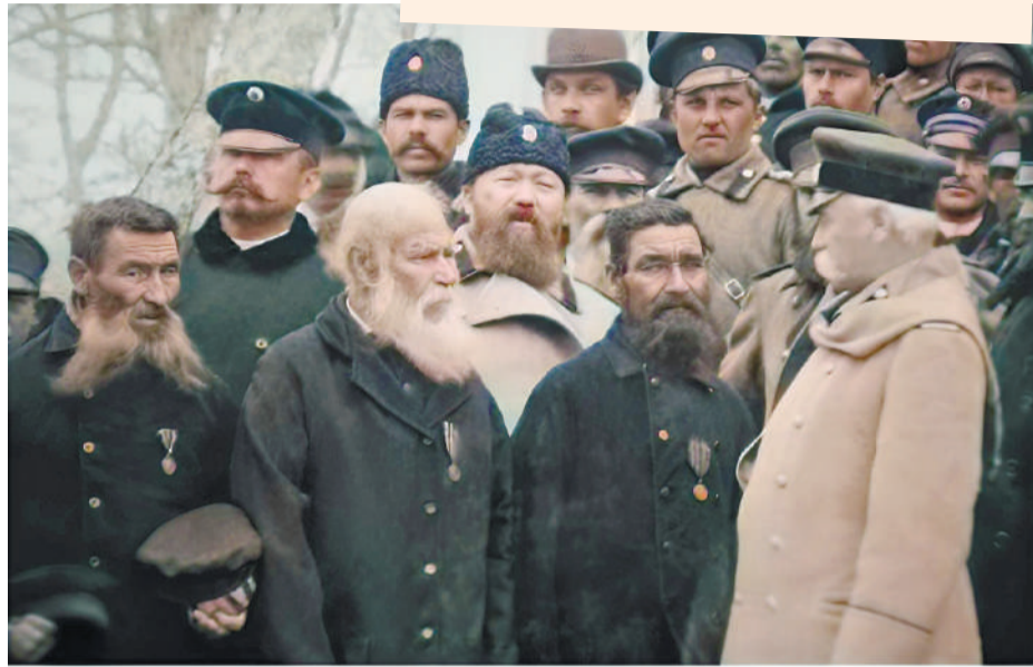
Приамурский генерал-губернатор С. М. Духовской беседует с ветеранами Петропавловской обороны 1854 г., 5 мая 1897 г.

Казачи были слабостью Духовского, в них он видел надежную опору государства, трудолюбивых землепашцев, готовых в любую минуту встать на защиту веры, царя и Отечества. Не без умысла назвал генерал-губернатор свой речной пароход «Атаманом»,