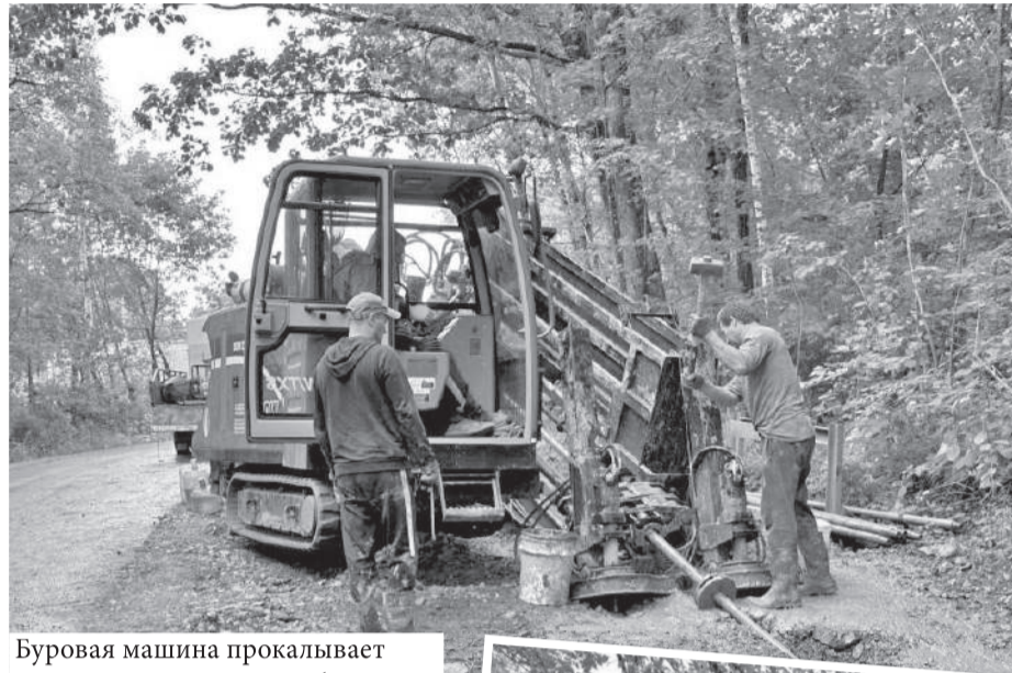
Буровая машина прокалывает грунт и протягивает трубопровод подземным способом на десятки метров