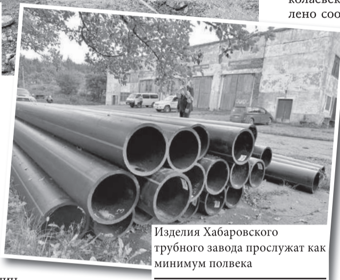
Изделия Хабаровского трубного завода прослужат как минимум полвека

Объекты водоснабжения и водоотведения в Бычихе создавались профсоюзами, располагавшими оздоровительными учреждениями в этом селе