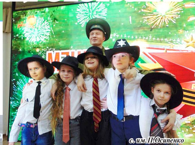
с. им. П. Осипенко