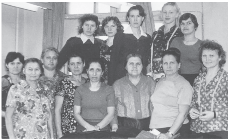
Вяземские работницы ателье

В 1979 году был построен дом по адресу ул. Коммунистическая, 9. На первом этаже был расположен «Дом быто-