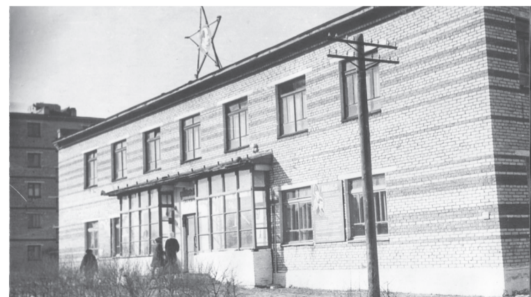
Здание ателье по ул. Орджоникидзе