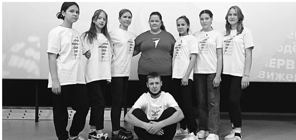
Первые села Капитоновка

местного отделения, презентовала движение РДДМ. Сегодня на территории района создано 14 первичных отделений «Движения Первых» на базе школ района и Вяземского лесхоза-техникума им. Н. В. Усенко. В ходе мероприятия