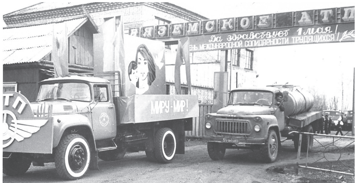
Работники АТП с гордостью представляли предприятие на праздниках