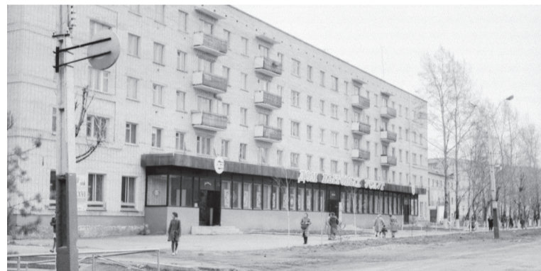
Дом бытовых услуг, ул. Коммунистическая