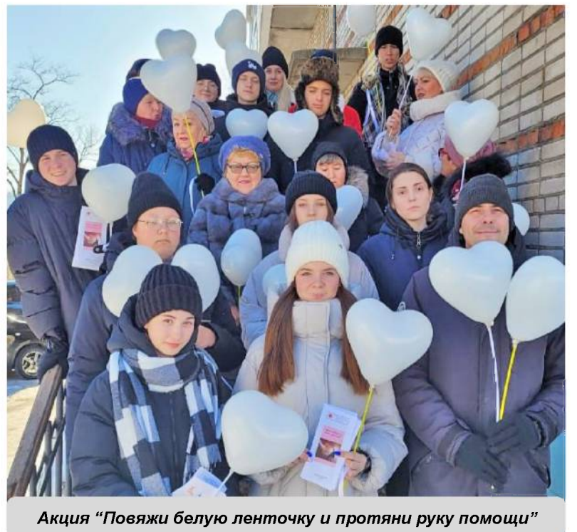
Акция "Повяжи белую ленточку и протяни руку помощи"