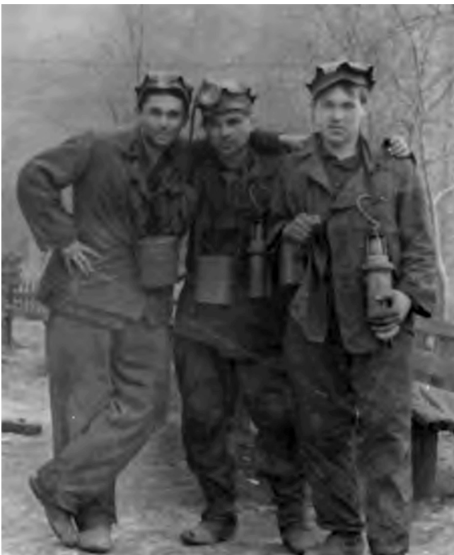
Перед спуском в подземную «Европу». Шахта 3 10 11.04.58 г.

*Террикон – отвал, искусственная возвышенность из обеднённых и пустых пород, извлечённых при подземной разработке месторождений угля