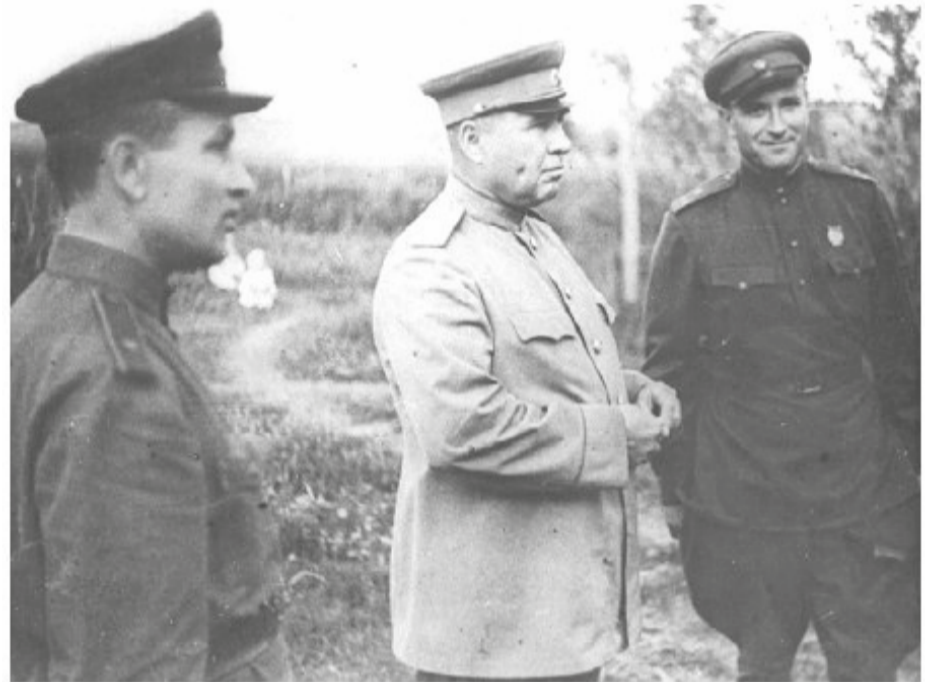
И. Апанасенко с офицерами. Воронежский фронт. 1943 г.

По всему было видно, что наша короткая, четкая деловая встреча подходит к концу. На стол поставили крепкий чай... И вдруг последовал вопрос к Апанасенко: «А сколько у тебя противотанковых пушек?» Генерал от-