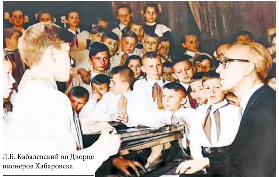
Д.Б. Кабалевский во Дворце пионеров Хабаровска

С того времени и завязалась переписка. «Москва, 8 сентября 1960 года. Дорогие друзья! Я часто и всегда с удовольствием вспоминаю о знакомстве с вашим обществом, беседах с вами, его участниками. И не только вспоминаю, но и рассказываю о том, какой хороший пример любви и интереса к серьезной, хорошей музыке подает ваша школа всем советским школьникам. Посылаю вам кантату Сергея