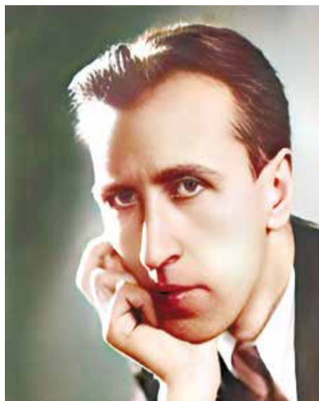
Дмитрий Борисович Кабалевский (1904–1987) – советский композитор, дирижер, пианист, педагог, публицист, общественный деятель

Что из сказанного Дмитрием Борисовичем записали в дневнике симфонического общества участники встречи, состоявшейся более полувека назад? «Музыка – это не просто развлечение, не добавление, не «гарнир» к жизни, а важная часть самой жизни. Жизни в целом и жизни каждого человека».