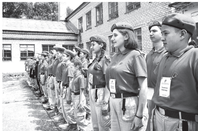
Районный слёт юнармейцев

ческую деятельность вовлечены около тысячи молодых граждан района. В единой системе в сфере развития добровольчества dobro.ru зарегистрировано более 500 волонтеров из нашего района, и эта работа продолжается.