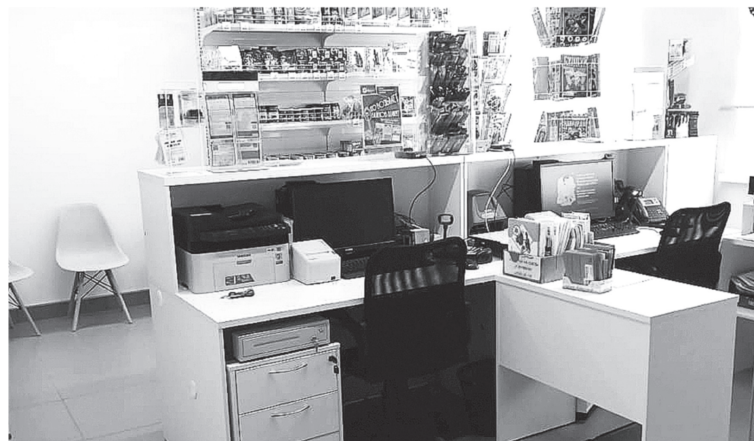
Клиентский зал почты в Бичевой сегодня

После капитального ремонта изменился внутренний облик почтового отделения, теперь здесь новые полы и всё инженерное оборудование: электрика, водоснабжение, отопление, система кондиционирования. В зале – удобная мебель и витрины с товарами и почтовой упаковкой. Дизайн помещения отвечает единому корпоративному стилю Почты России.