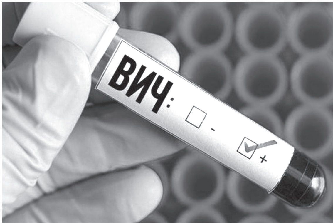
Регулярно сдавайте анализ крови на ВИЧ/СПИД.

У многих в наше время присутствуют свободные отношения, беспорядочные половые связи, поэтому как никогда актуально каждому знать свой ВИЧ-статус! – настоятельно советует врач. – Это важно как для него самого, так и для его близких и родных. Недавно молодая женщина, уже