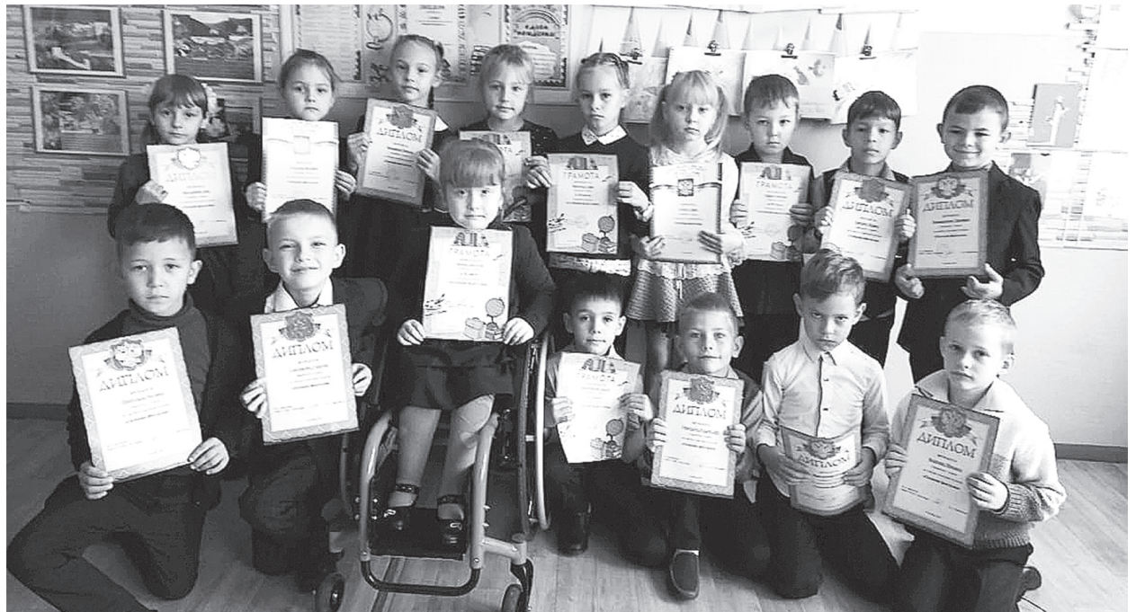
Инвалидность – не приговор!