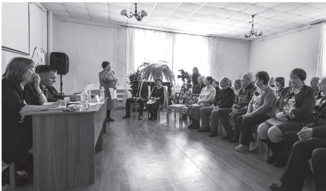
Диалог с властью

По-прежнему актуальной для жителей поселка остается проблема капитального ремонта дорог, и ее тоже озвучили ветераны. Капитально отремонтировать дороги можно только за счет средств поселе-