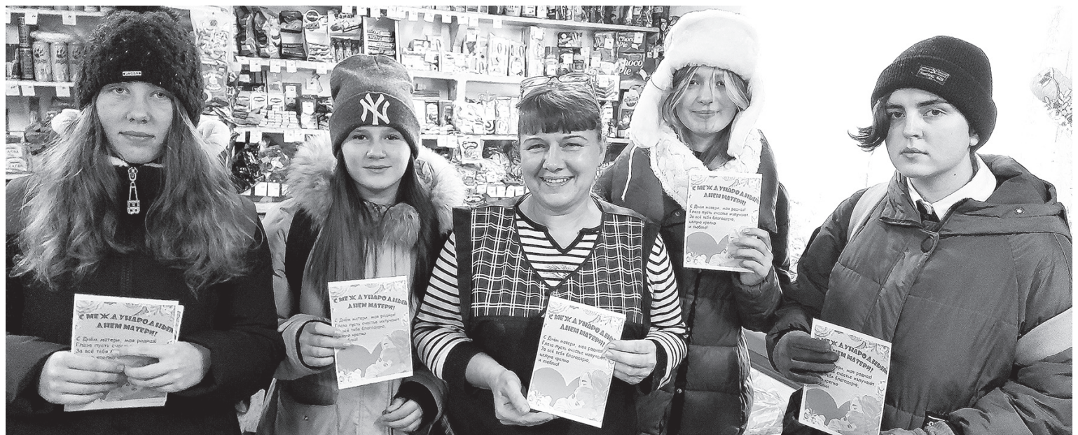
Открытки для матерей