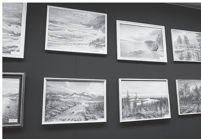
Пейзажи родного края

стене, бумаги-то и красок не было. Еще пацаном расписал стену местного клуба. Ругать мальчишку не стали, наоборот, попросили нарисовать еще что-нибудь. Так появился его первый морской пейзаж. Морем он тоже «заболел» с детства. А тут еще в армии один из его сослуживцев с таким упоением рассказывал о красотах и водных просторах Дальнего Востока. Так что после демобилизации, не заезжая домой, отец сюда и рванул. Да так здесь и остался... В Находке устроился на судно рыбаком и пошел в море, в Охотске познакомился с мамой. Потом они переехали в Хабаровск. Куда бы потом ни забрасывала его судьба, будь то озеро Иссык-Куль в Киргизии или север Охотского района – всюду находил он время