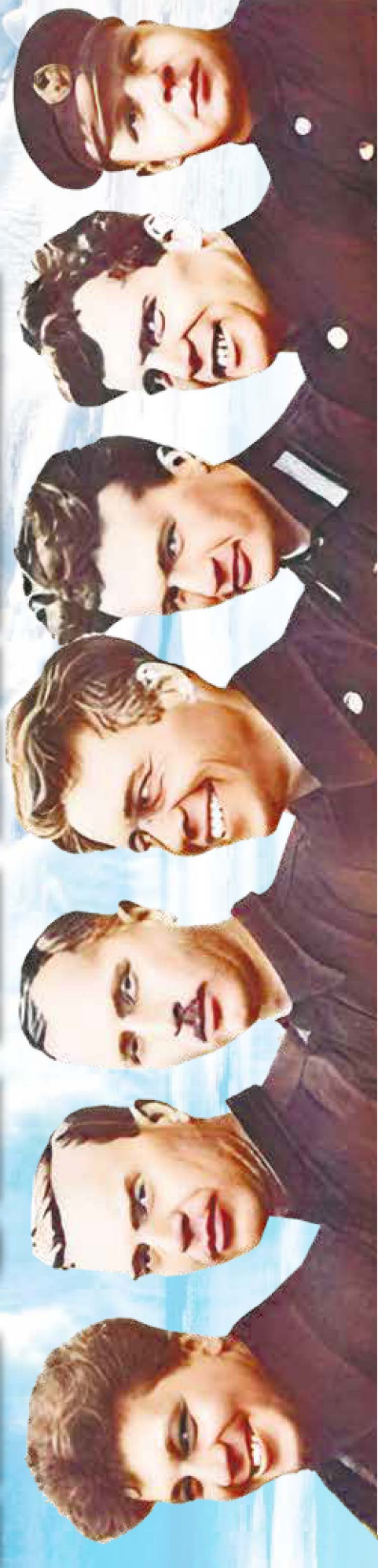
Летчики-герои: А. Ляпидевский, С. Леваневский, М. Слепнев, В. Молоков, Н. Каманин, М. Водопьянов, И. Доронин

– Шмидт тогда приехал в Ленинград, в университет, и читал математические лекции «о сотворении мира». (Смеется.)