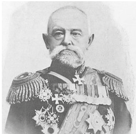
Командующий Приамурским военным округом Н.П. Линевиц