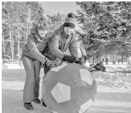
ФОТО ПРЕСС-СЛУЖБЫ МИНИСТЕРСТВА СПОРТА КРАЯ

В этом году главными участниками состязаний на самом большом открытом бесплатном семейном катке Дальнего Востока, расположенном на набережной Амура в Хабаровске, станут спортивные семьи, которые посоревнуются в ловкости