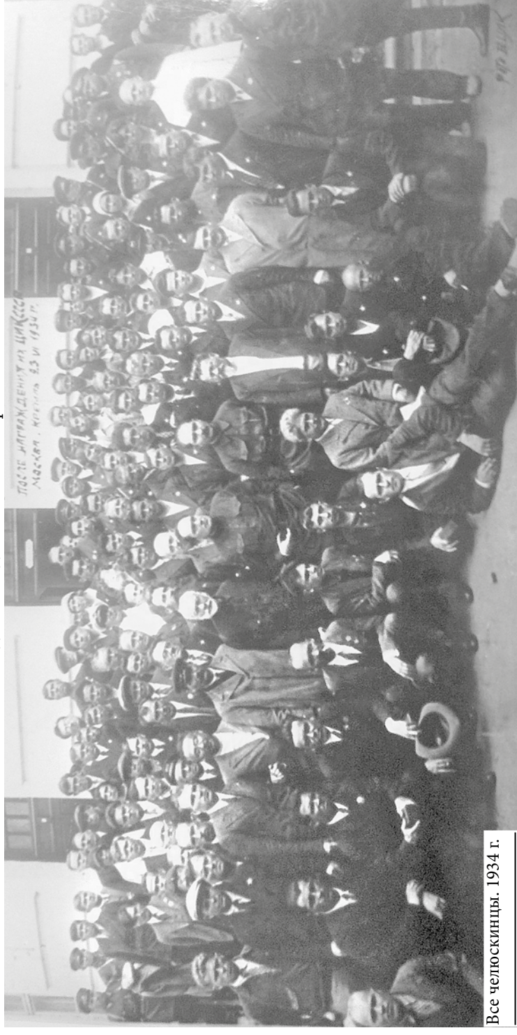
Все челюскинцы. 1934 г.

– Коллекция формируется до сих пор. А начала она собираться в 1936–1937 годах, – поведала директор на экспозиции. У нас есть макет ледово-