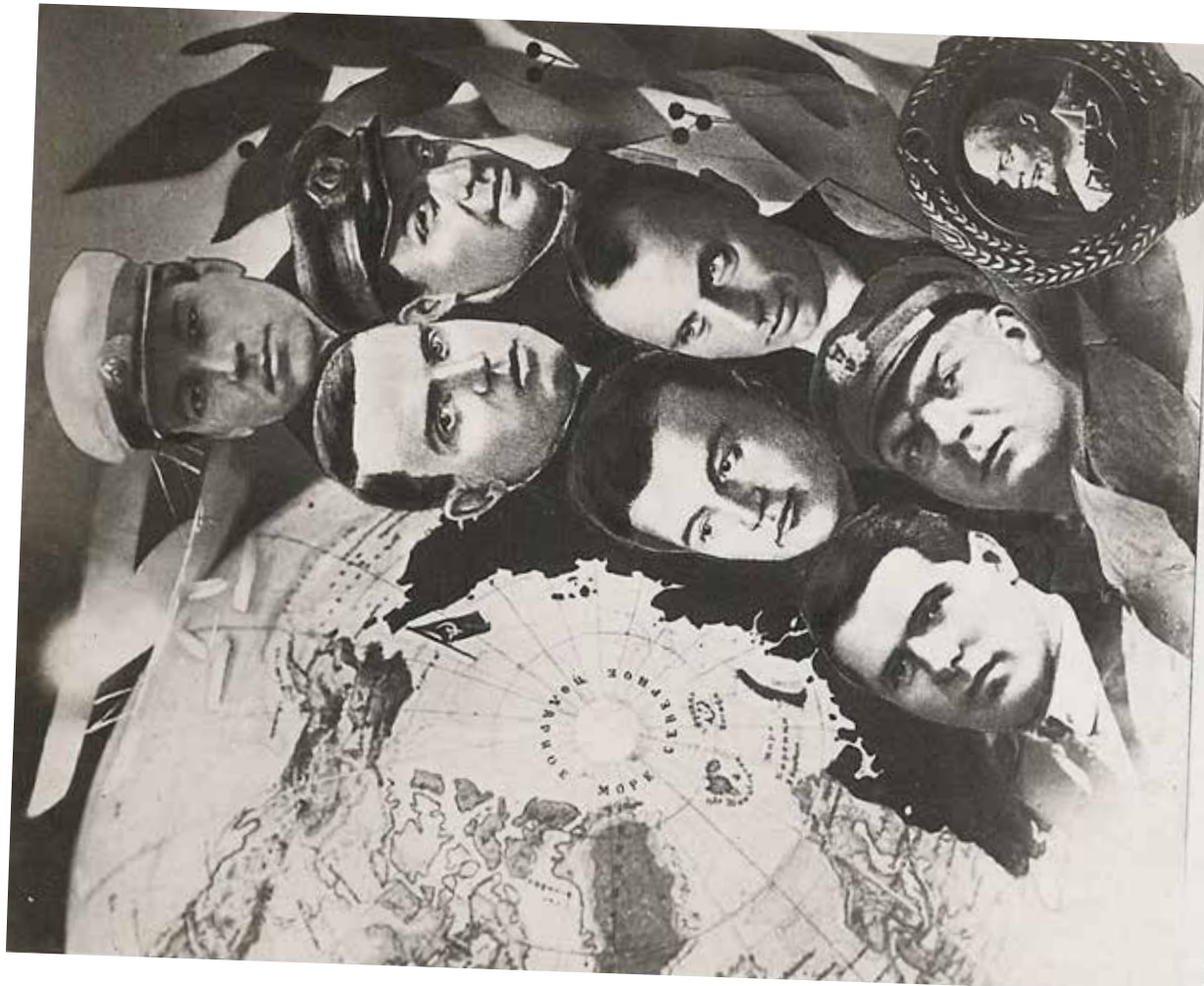
Герои Советского Союза. Летчики — Ляпидевский, Лебедевский, Молоков, Каманин, Слепнев, Водопьянов, Дорохин. — Спасшие челюскинцев.