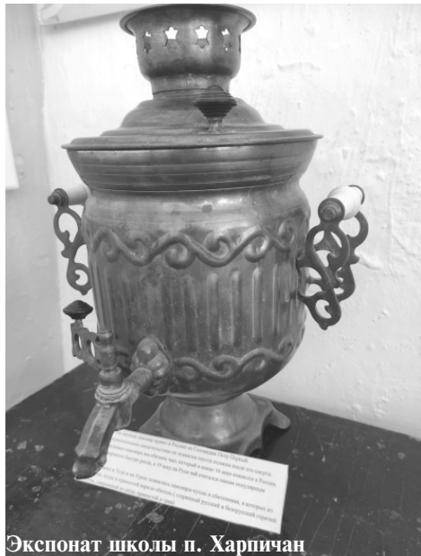
Экспонат школы п. Харпичан