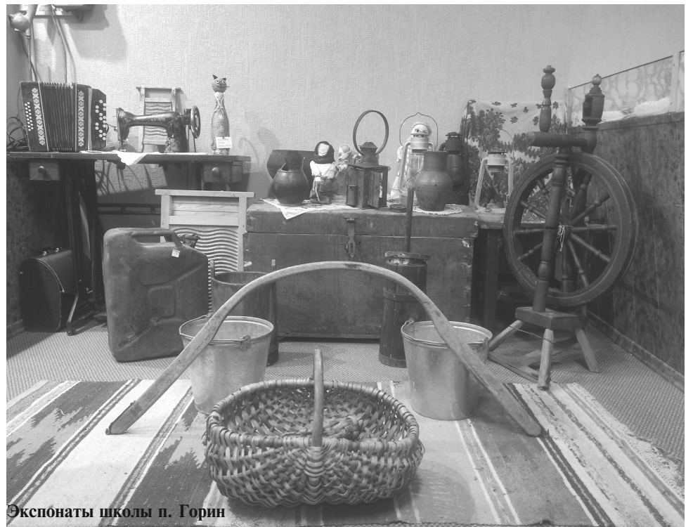
Экспонаты школы п. Горин